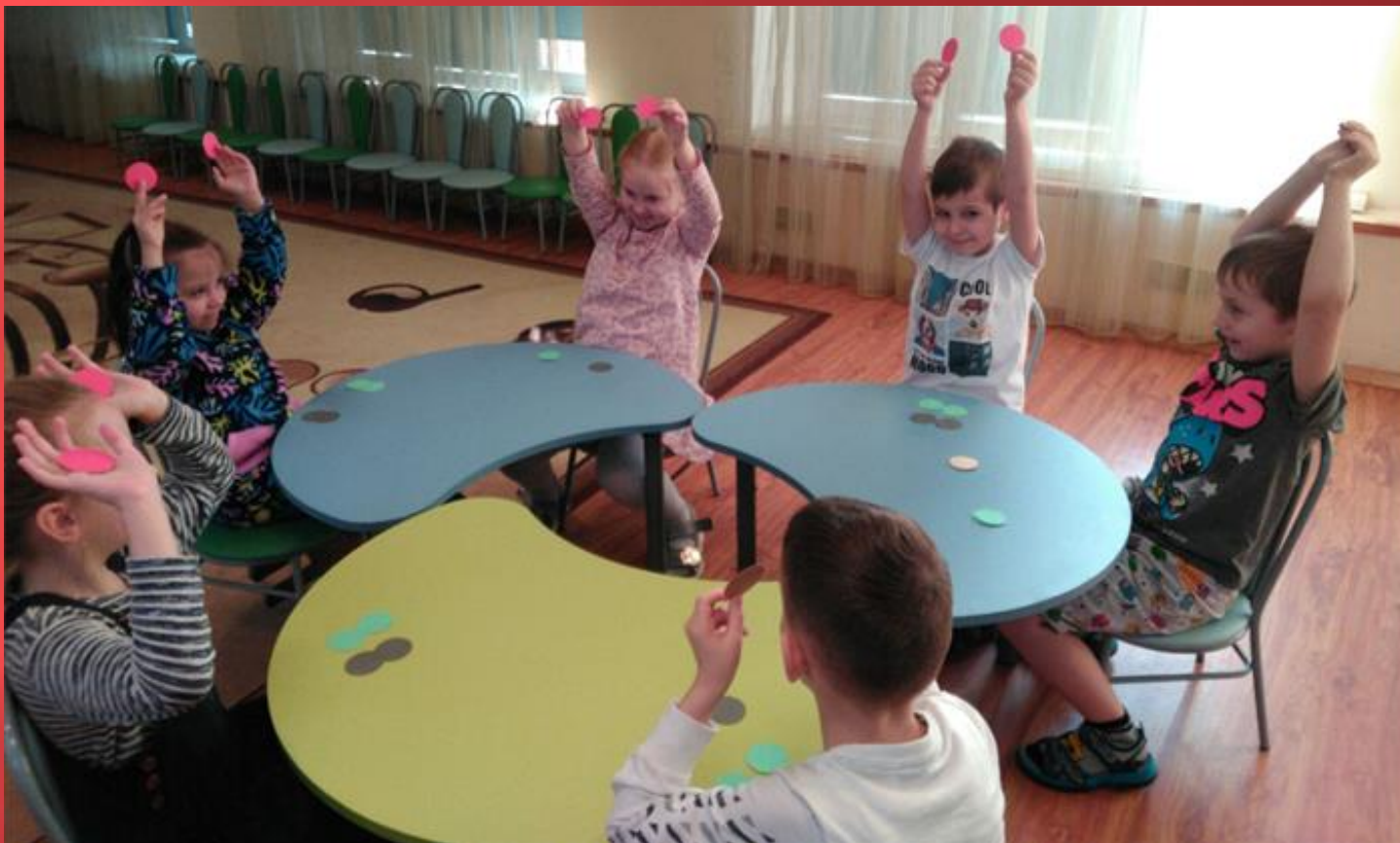
Музыкальная дидактическая игра «Весело – грустно».