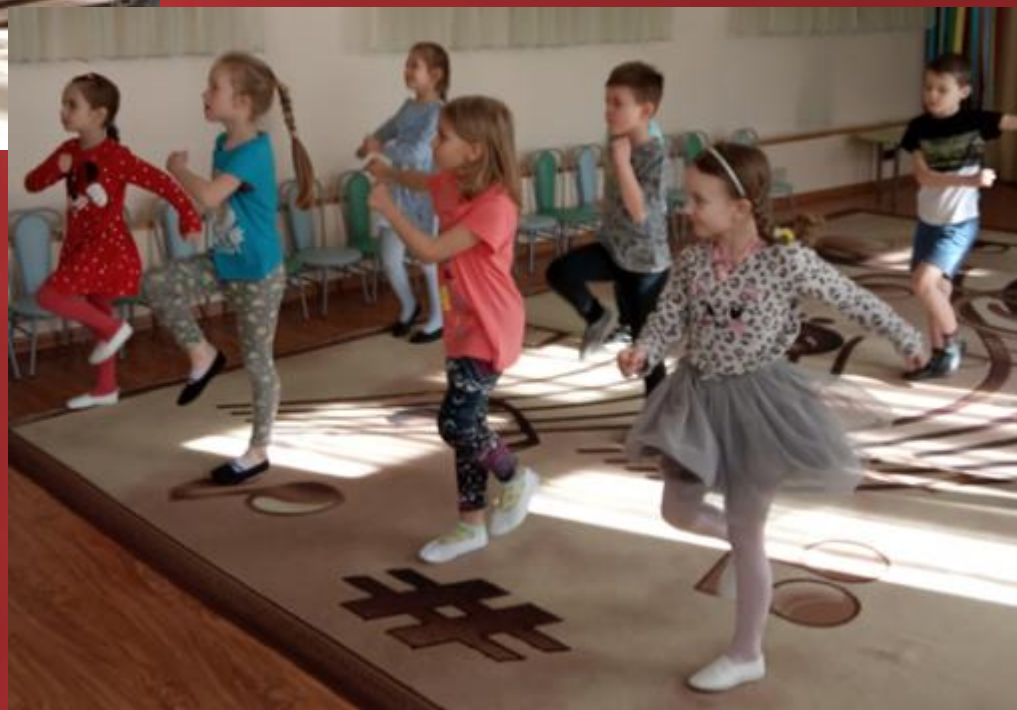
Музыкальная импровизация «Марш деревянных солдатиков»