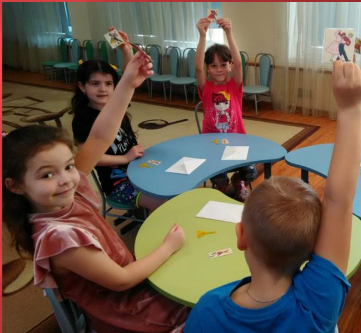
Музыкальная дидактическая игра «Что делают дети?».