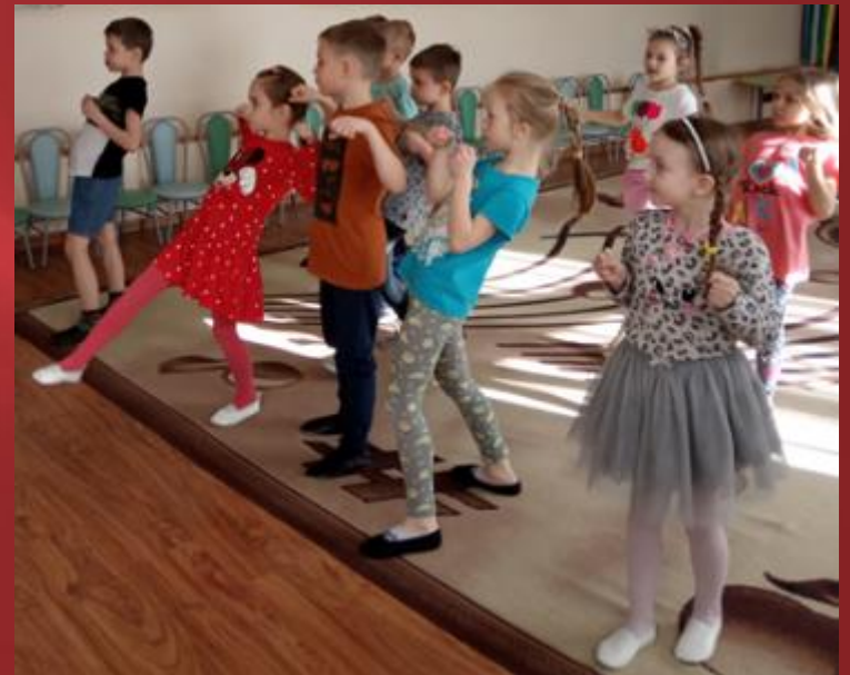
Музыкальная импровизация «Игра в лошадки»