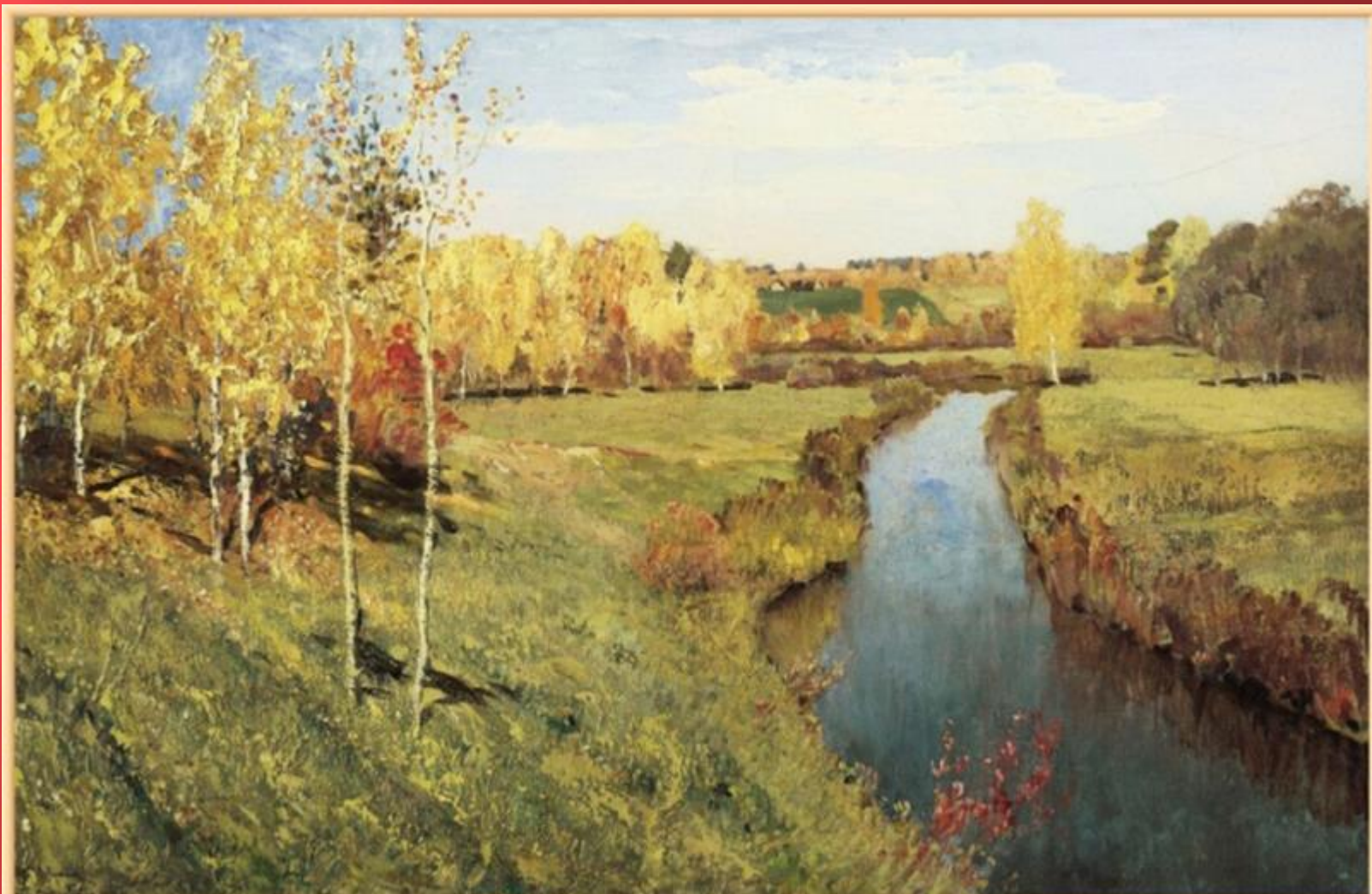
▣ Исаак Левитан «Золотая осень»