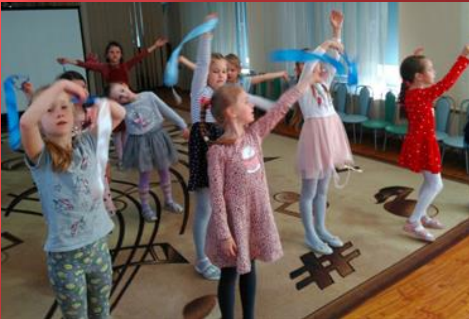
«Вальс» ( с ленточками).