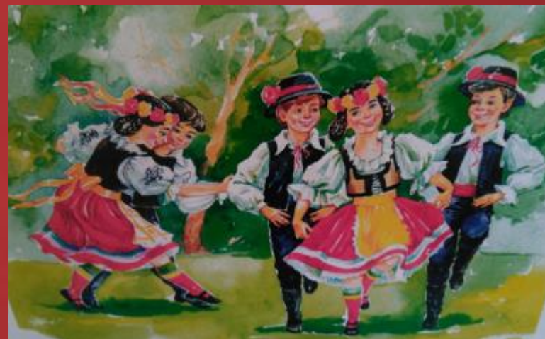
Танцевальные движения «Полька»