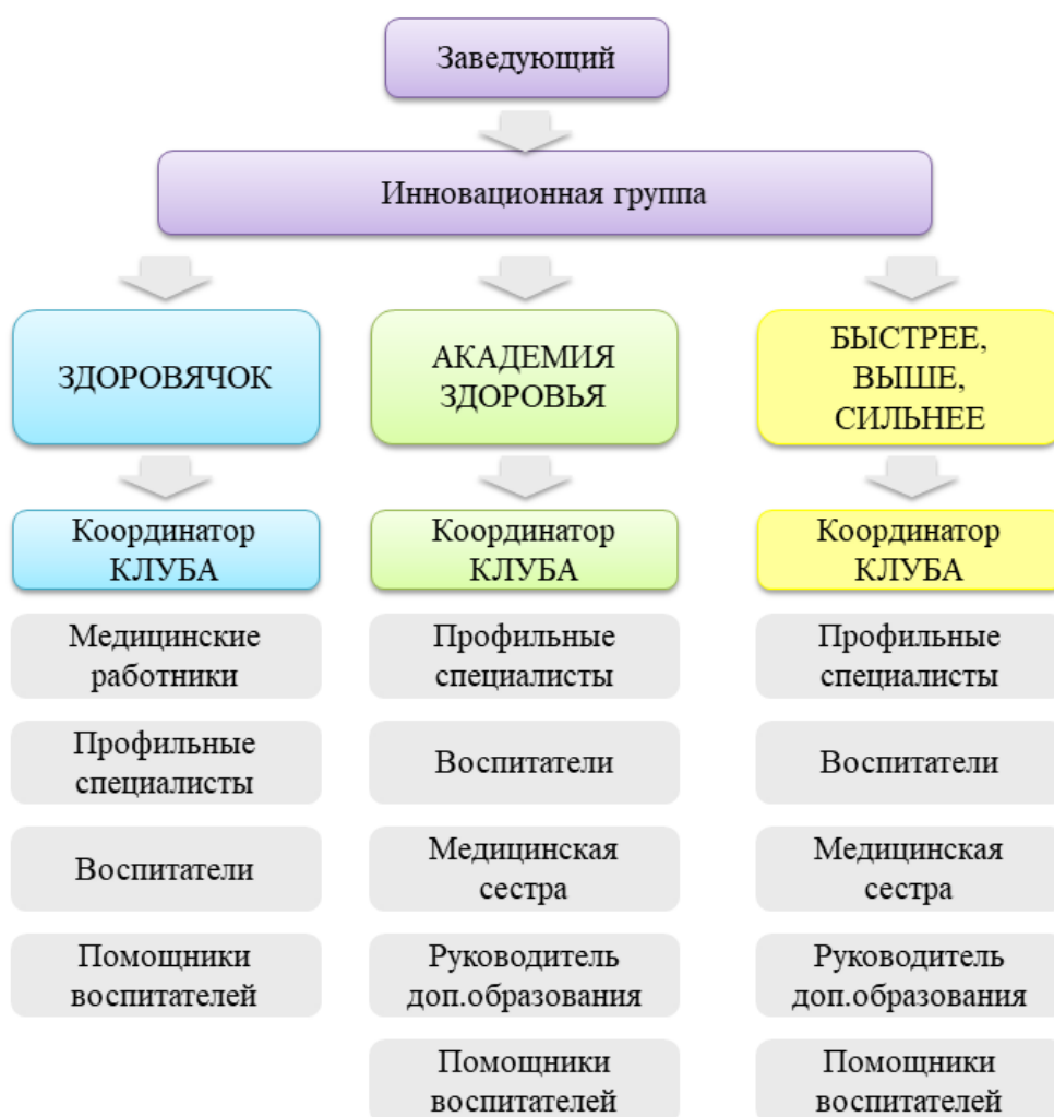
Рисунок 1. Управленческая структура проекта

Управление проектом осуществляет руководитель проекта – заведующий. Руководитель проекта создает проектную группу из числа сотрудников, руководит работой по планированию деятельности, координирует участие в реализации проекта всех заинтересованных партнеров, назначает ответственных за проведение мероприятий. Для регулярного отслеживания промежуточных и итоговых результатов проводит оперативные совещания с ответственными исполнителями и партнерами, заслушивает отчеты, анализирует полученные данные на соответствие содержанию работы, срокам ее выполнения и предполагаемым результатам. При необходимости лично проводит оперативный контроль за ходом работ (рисунок 1. Управленческая структура проекта).