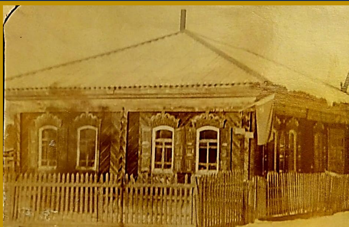
- Лавка купца Тобокова Д.М.

- 1920 году в этом здании разместили сельский