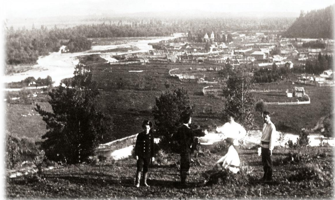
Казанский храм в Ынырге 1901 год