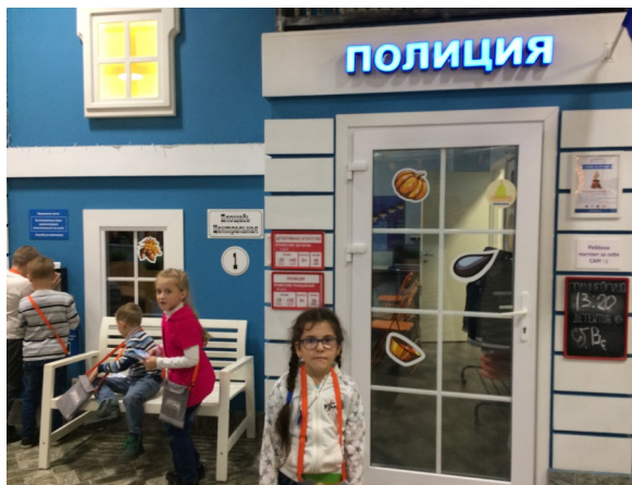
Рис. 3. – Посещение «Кидбурга» («Города профессий»)

Также родители (законные представители) могут отправиться на экскурсию с детьми по своему усмотрению и применить любые формы фиксации своих наблюдений. Взрослые с детьми могут посетить своё рабочее место, отправиться на мастер-классы, которые всё чаще организуют предприятия (кондитерская фабрика, фабрика новогодних игрушек, пиццерии, хлебзавод, музей ГАЗ), сдать вторсырьё в пункты переработки.