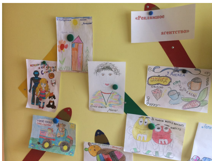
Рис. 1. – Выставка образцов рекламы

Одной из перспективных форм взаимодействия с семьями воспитанников, способствующих решению задач экономического воспитания, является маршрут выходного дня. Маршрут выходного дня – разновидность экскурсии, особая форма взаимодействия детей и взрослых, позволяющая изучать конкретные объекты или явления окружающего мира. Основу маршрута выходного дня составляет заранее определенная траектория движения или набор заданий, необходимых для выполнения. Задания определяются педагогом и вносятся в маршрутный лист. В качестве маршрутов выходного дня можно выбрать посещение продуктового или хозяйственного магазинов, фермерского рынка, торгового центра, аптеки, отделения почты, банка и т.д.