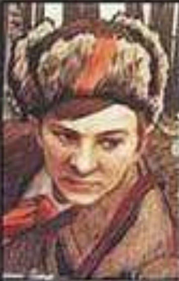
Валя Котик, 14-летний Герой Советского Союза (звание присвоено посмертно).