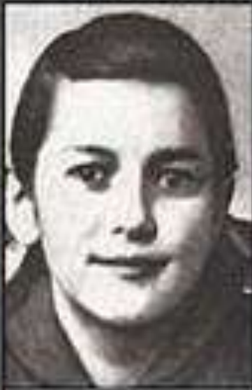
Зина Портнова, убила фашиста на допросе из его же пистолета. Была замучена пытками.