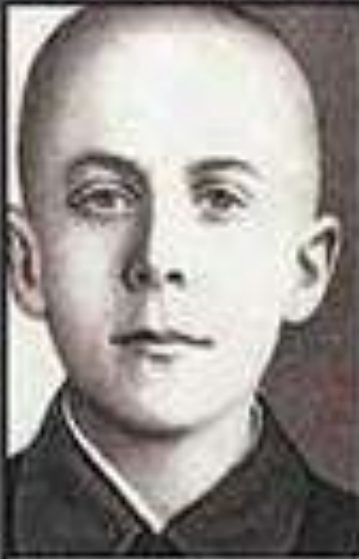
Марат Казей, юный разведчик из партизанского отряда, взорвал себя и окружающих его фашистов гранатой.