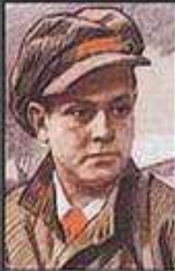
Лёня Голиков, партизан, убил фа- шистского генерала и добыл важные документы. Погиб в бою.