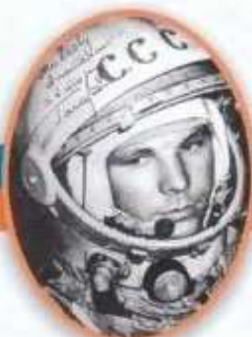
Юрий Алексеевич Гагарин Первый космонавт