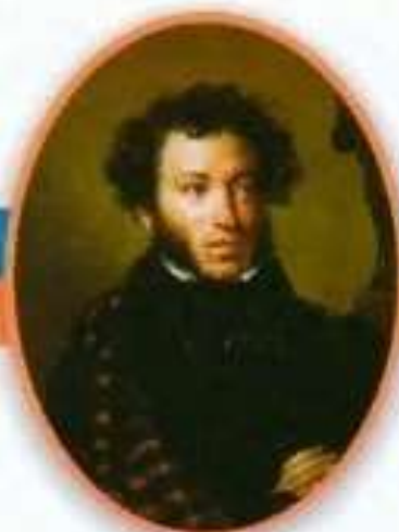
Александр Сергеевич Пушкин Великий русский поэт