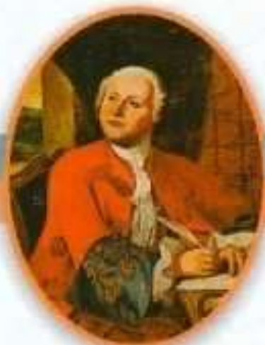
Михаил Васильевич Ломоносов Великий русский ученый

Ты, конечно же, вспомнишь, что Александр Сергеевич Пушкин написал много прекрасных стихов и чудесные сказки: «Сказка о царе Салтане», «Сказка о рыбаке и рыбке», «Сказка о мертвой царевне и о семи богатырях», «Сказка о золотом петушке». Петр Ильич Чайковский писал необыкновенно красивую музыку, создал цикл пьес «Времена года» и хорошо знакомый тебе «Детский альбом». Михаил Васильевич Ломоносов — великий русский ученый, он многого добился в самых разных областях знаний: литературе и искусстве, физике и астрономии, географии и истории. Им сделано много важных научных открытий. Юрий Алексеевич Гагарин был первым космонавтом, первым человеком, облетевшим на космическом корабле «Восток-1» нашу планету.