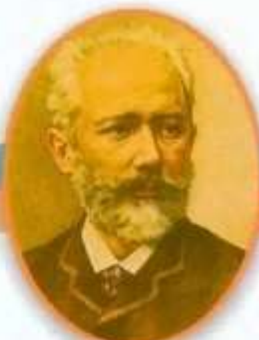
Петр Ильич Чайковский Великий русский композитор