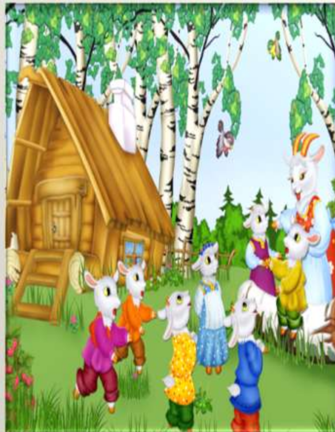
«Козлятки и волк»