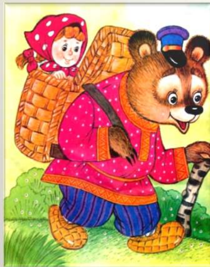
«Маша и медведь»