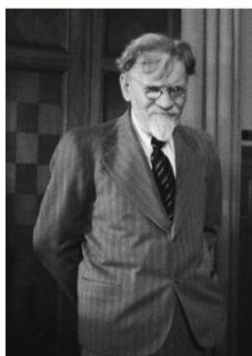
Старик-снайпер из царских академиков

За один месяц так называемой фронтовой командировки 87-летний академик Николай Морозов отправил на тот свет с десяток гитлеровцев. Старик успешно передвигался ползком между стрелковыми снайперскими позициями на передовой, порой залегая на несколько часов даже в снегу. Видавший виды снайпер пользовался на фронте почетом, на него приходили посмотреть из соседних частей. В военкомат царский ученый-дворянин явился добровольцем. Ввиду более чем