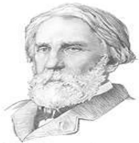
Иван Сергеевич Тургенев 1818—1883