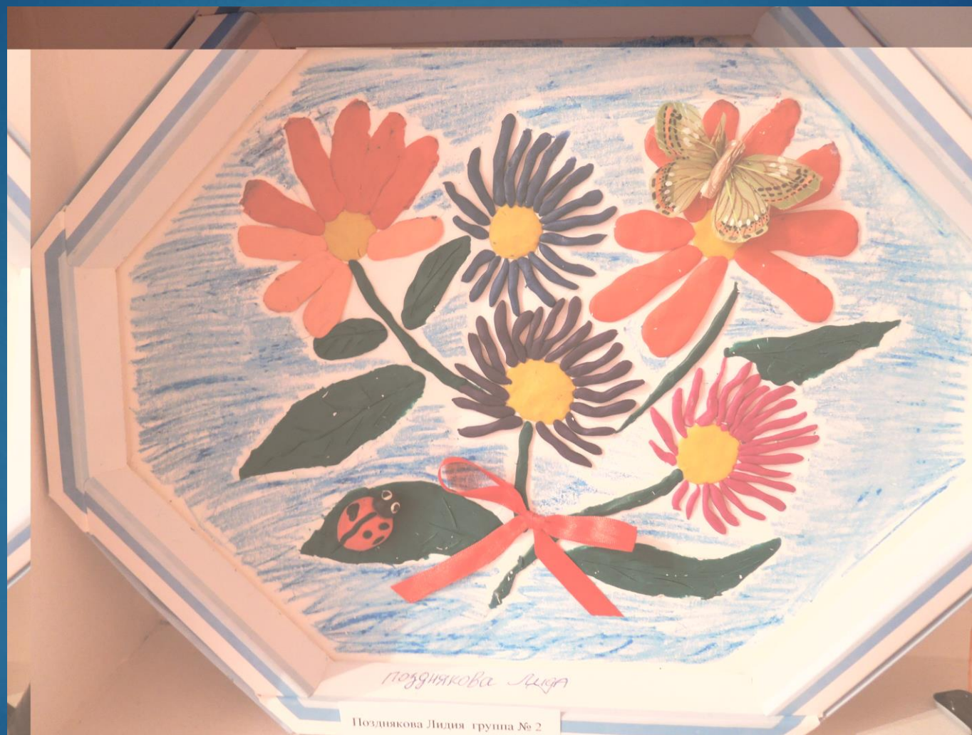
Позднякова Лидия группа № 2