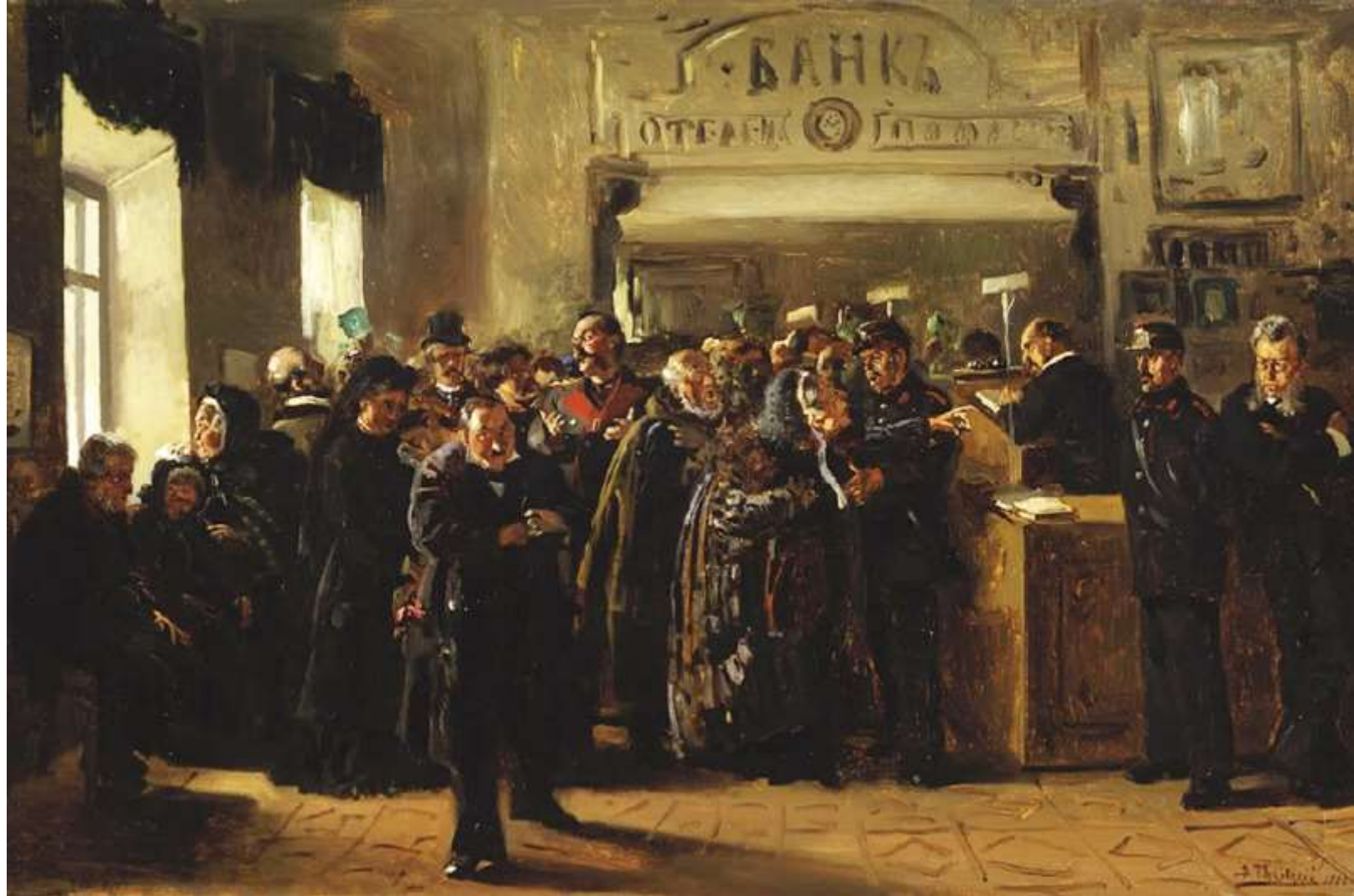
Владимир Маковский «Крах банка»

Скопинского банка в 70-е – 80- е годы XIX века. Жертвами коммерческих махинаций банкиров, в основном, стали состоятельные горожане.