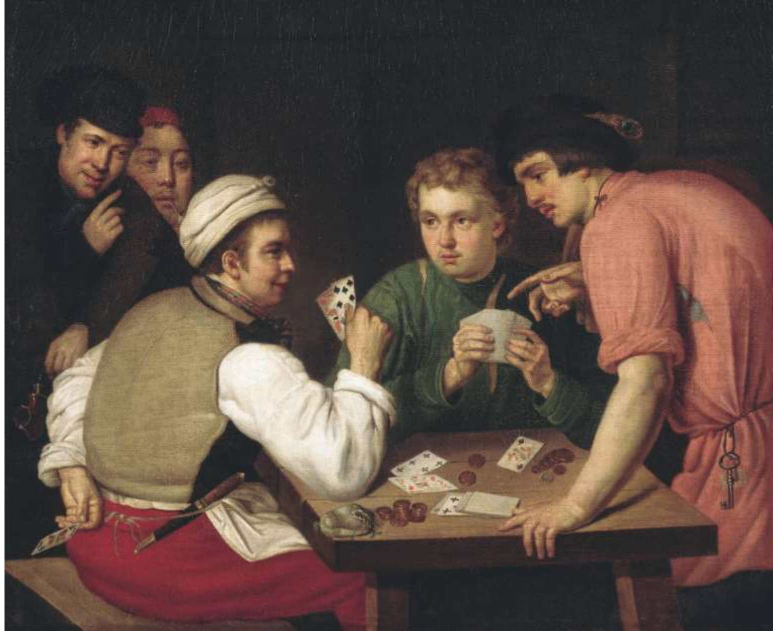
Иван Тупылев «Плутовская игра» 1780-е годы.

Мужчина, одетый как голландский купец, обыгрывает в карты наивного русского крестьянина.