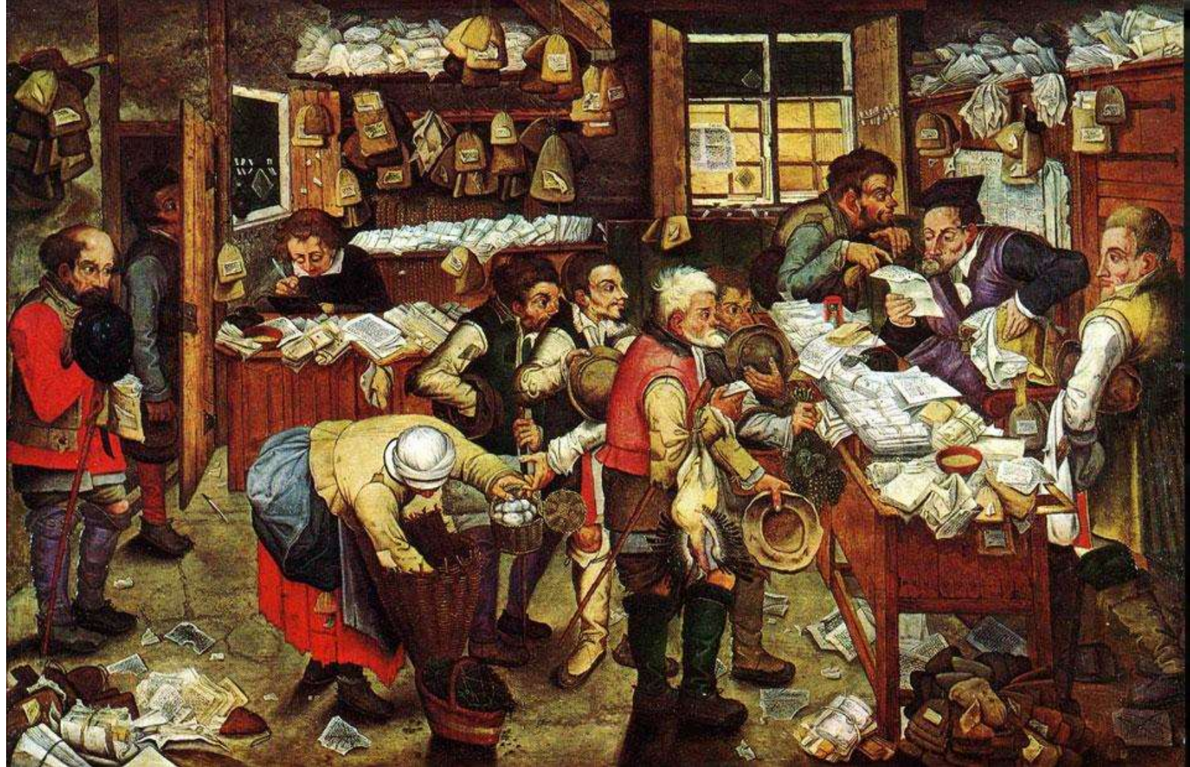
Питер Брейгель Младший. «Деревенский адвокат»

В картине художник подчеркивает насмешливое отношение крестьян к юристам, а вернее, к тем, кто у них деньги отбирает. 1618г.