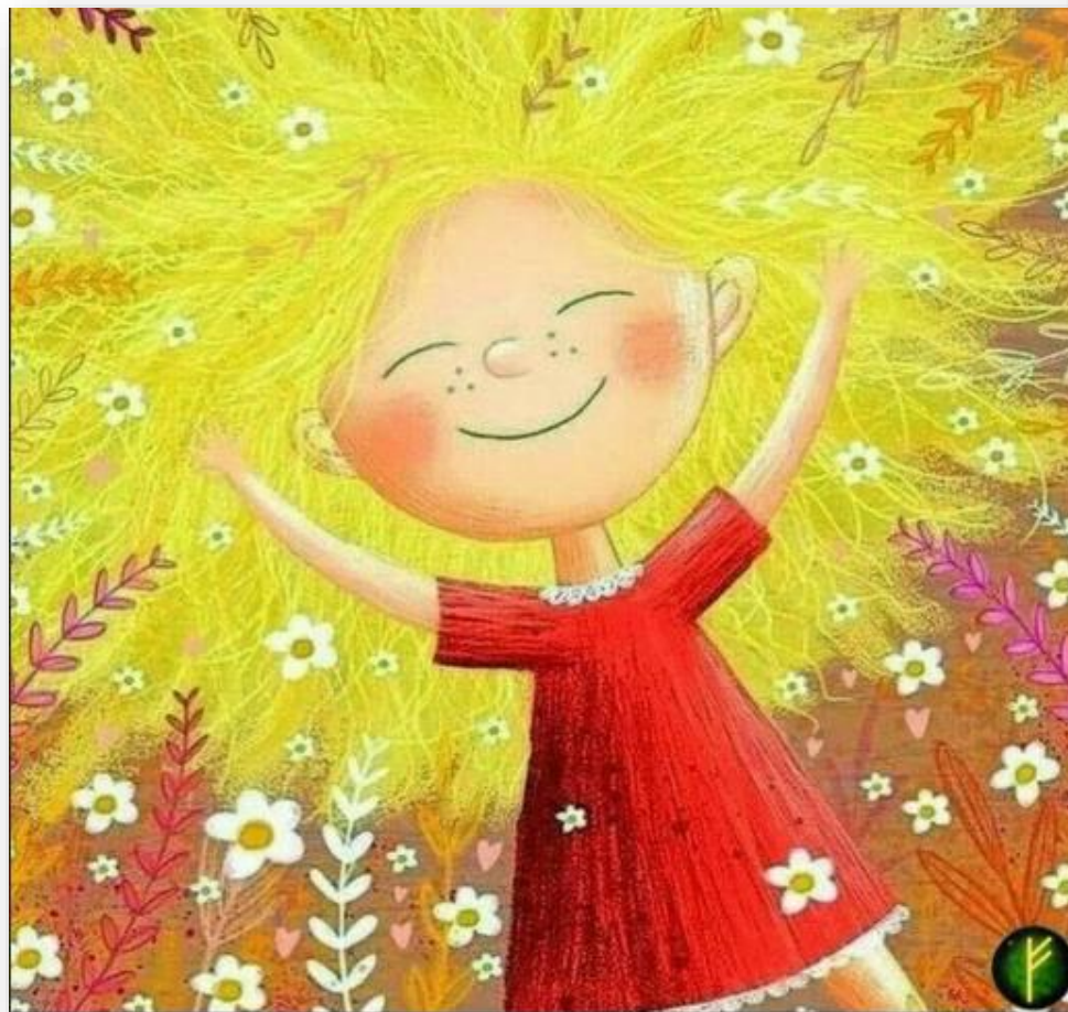
Всем спасибо за прекрасные материалы.