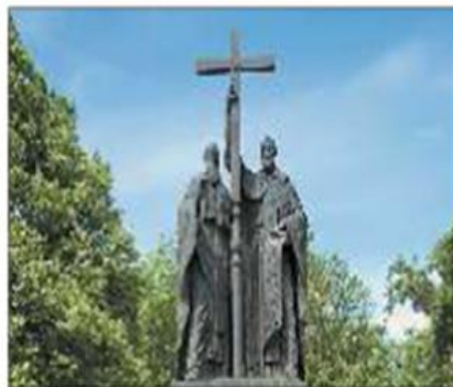
Памятник святым равноапостольным Кириллу и Мефодию в Москве. Скульптор В. М. Клыков. 1992

► Кирилл и Мефодий канонизированы (объявлены святыми) не только православной, но и католической церковью. Память святых Кирилла и Мефодия православная церковь отмечает 24 мая. В России и Болгарии этот день стал праздником — Днём славянской письменности и культуры. ◀