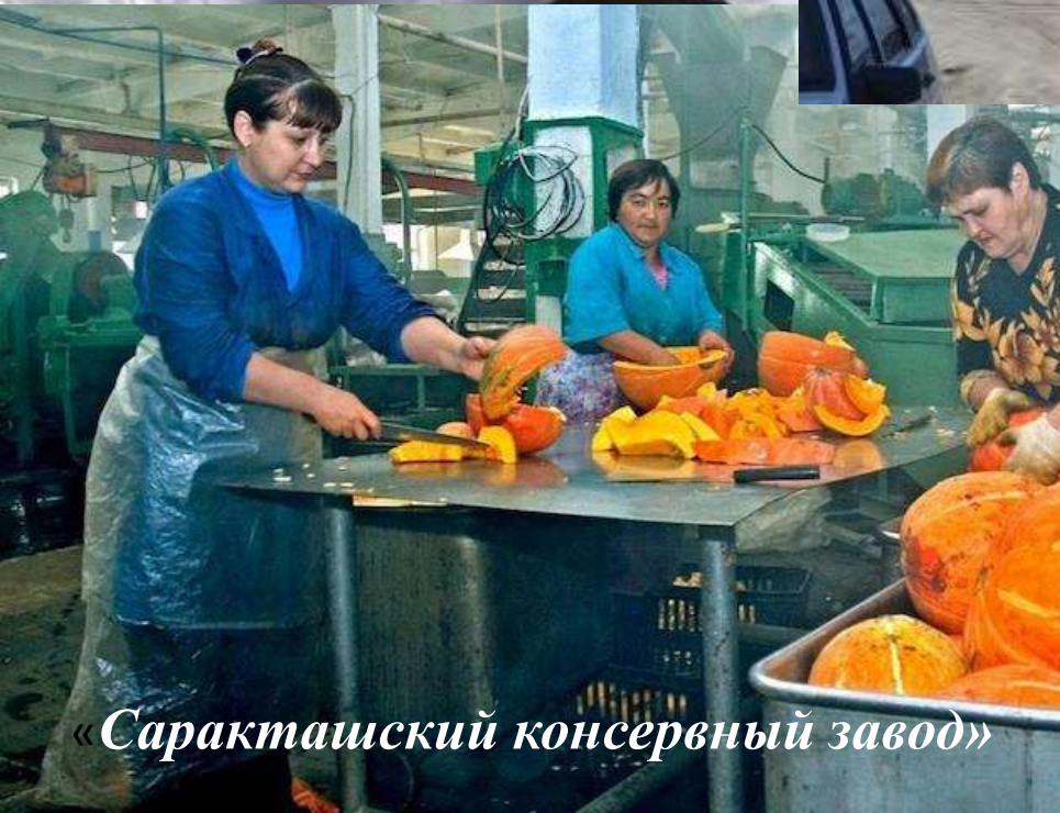
«Саракташский консервный завод»