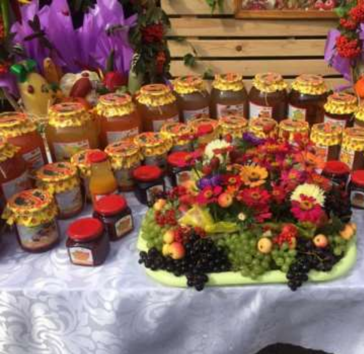
Саракташский завод «Коммунар»