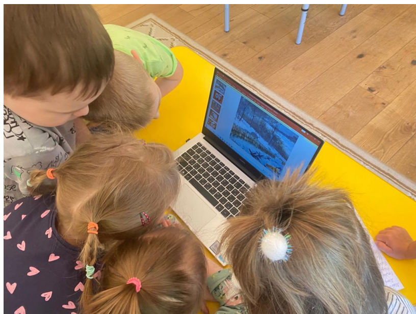
Рассматривание фотоальбома (фотохроника военных дней)