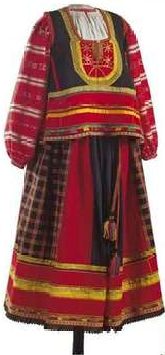
РУБАХА И САРАФАН