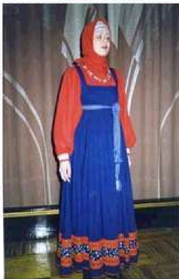
ТРАДИЦИОННЫЙ РУССКИЙ СИНИЙ САРАФАН

Юбка как отдельный элемент одежды появилась достаточно поздно, в 18 веке. Необходимо отметить, что в различных областях России национальный костюм различен. В северной части России носили сарафан, а в южной части носили поверх рубахи поневу. Цвет сарафана тоже имел значение. Красный сарафан шила мать дочери на свадьбу. Все предметы народного русского костюма всегда широкие и длинные.