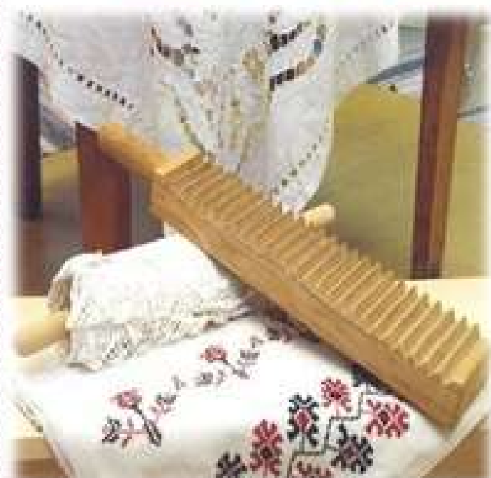
РУБЛЬ И ВАЛЕК

На Руси были своеобразные приспособления для стирки, глажки и хранения белья.