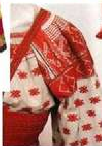
РУБАХА, ПОНЕВА, НАВЕРШНИК