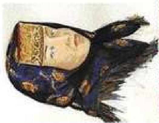
ПОВЯЗКА С ПЛАТКОМ