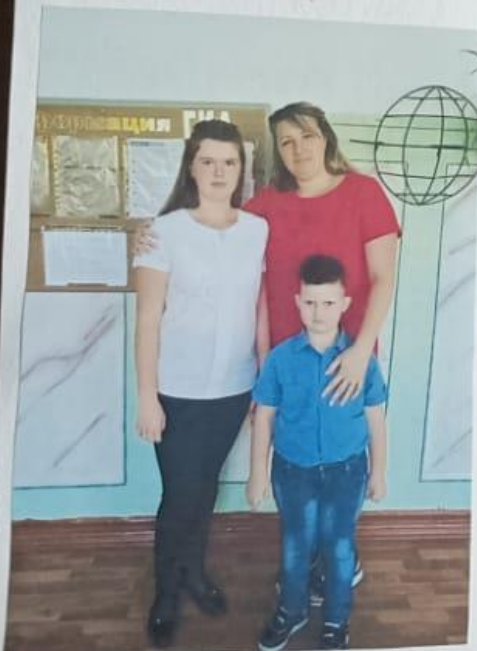
Я такой, как за кашенной