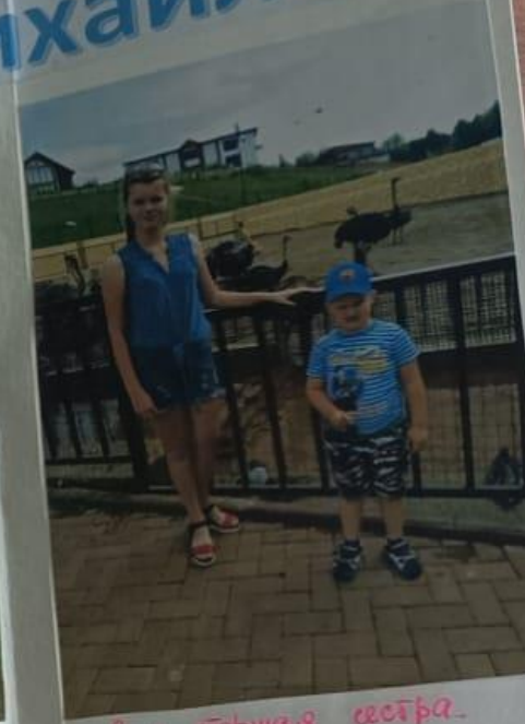
Я и старшая сестра.