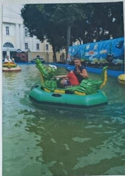
отдых с папой.