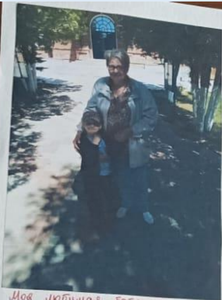
Моя любимая бабушка.