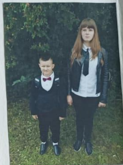
Первый раз в первый класс.