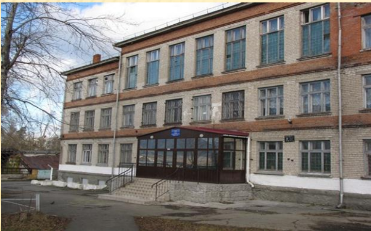
ШКОЛА № 3