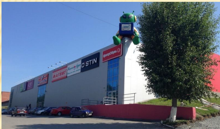
ТОРГОВЫЙ ЦЕНТР «ВОСТОК»