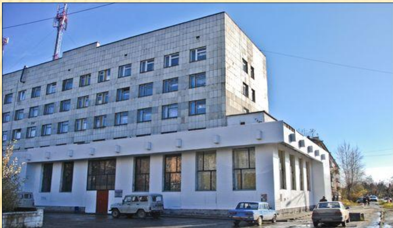
ПОЛИКЛИНИКА ДЛЯ ВЗРОСЛЫХ