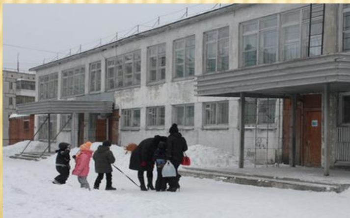
НАШ ДЕТСКИЙ САД «ЛАДУШКИ»