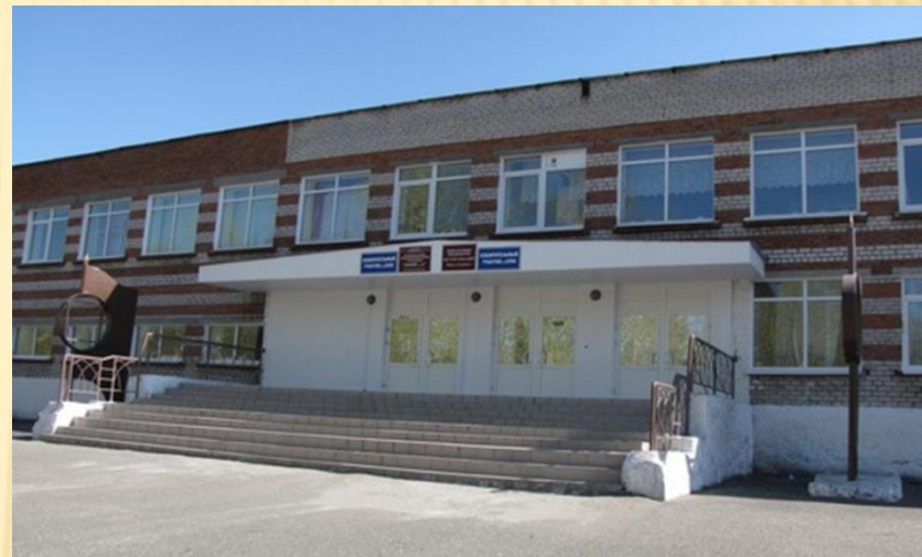
ЛИЦЕЙ № 6