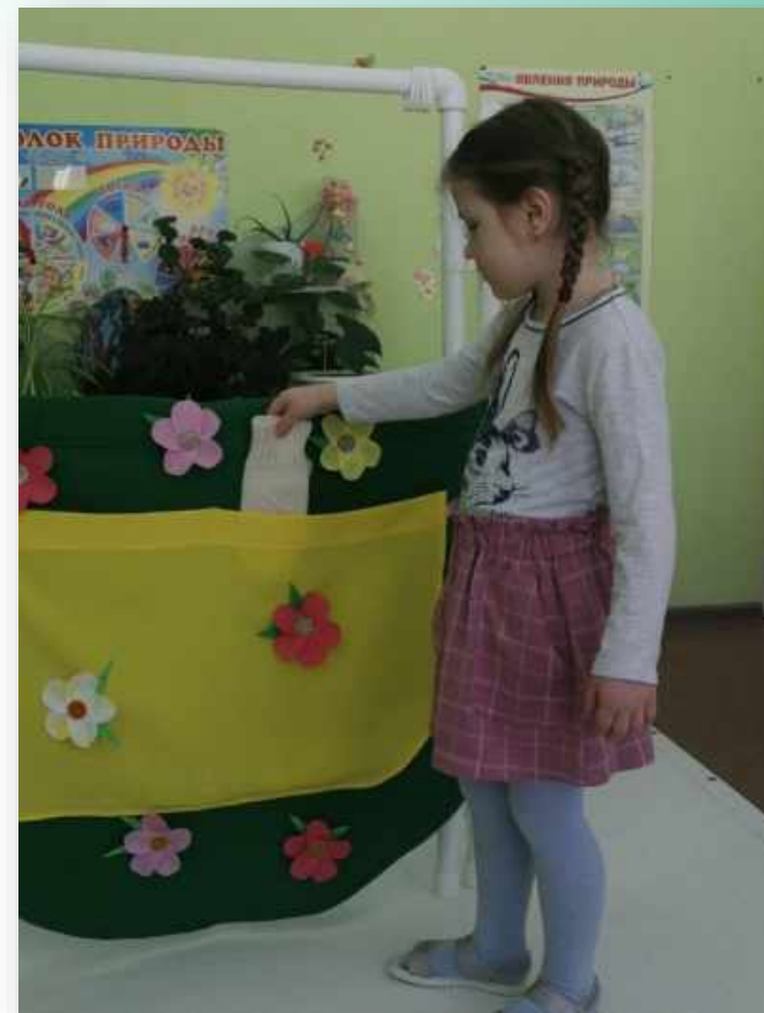
Вытаскивание варежки из кармана фартука