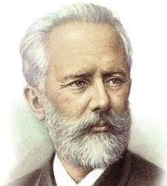
П. И. Чайковский

Помните, что даже человек, одаренный печатью гения, ничего не даст не только великого, но и среднего, если не будет адски трудиться».