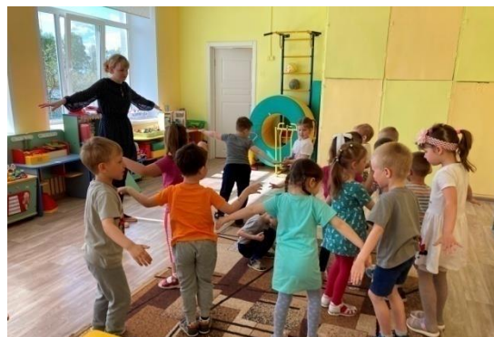
Подвижная игра «Летчики на аэродром»