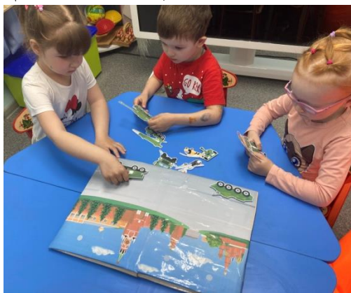
Игра с липучками «9 мая»

- Экскурсия к памятнику Н.Д. Фильченкова;