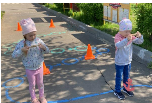
Эстафета «Поднять якорь»