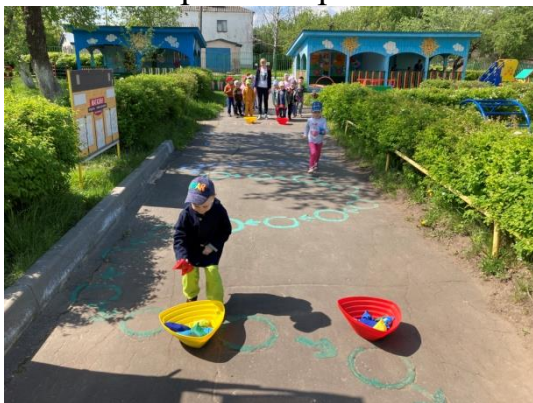
Эстафета «Склад боеприпасов»

- Спортивное развлечение «Военные на учениях»;