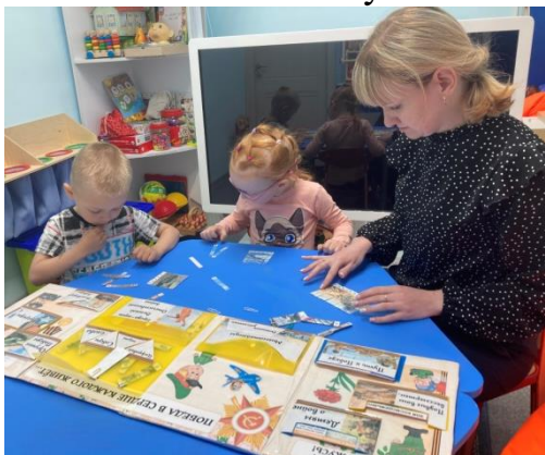
Игра «Цифровые пазлы»

- Работа с лэпбуком «9 мая – День Победы»;