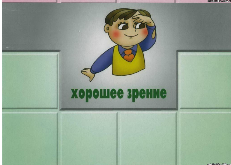
Игровое поле 2