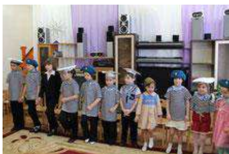
Юные защитники Отечества.

Будем надеяться, что сотрудничество это обязательно продолжится, и встречи воспитанников центра с Кировскими поэтами станут регулярными.