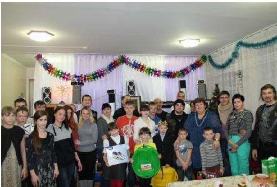
Новогодняя акция для детей.

Закончилась встреча вручением подарков детям и чаепитием. Ребята тоже поздравили мужественных друзей-байкеров с наступающими праздниками и подарили, сделанный своими руками, талисман года.