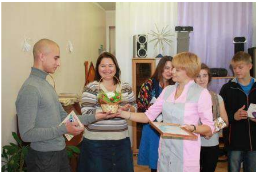
V Всероссийская выставка-форум " Вместе ради детей"