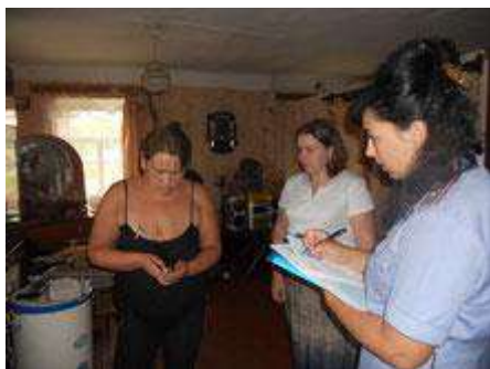
"Ты - будущий избиратель"

года принимали участие во втором этапе оперативно-профилактического мероприятия «Подросток и игла», направленного на осуществление совместного патронажа семей с детьми и подростками, состоящих на учете в ПДН МО МВД России «Кировский» и на обслуживании в отделении профилактики детского и семейного неблагополучия ГБУ КО «Кировский центр социальной помощи семье и детям «Паруса надежды», находящихся в трудной жизненной ситуации, социально-опасном положении. При посещении семей были проведены профилактические беседы по предупреждению совершения несовершеннолетними правонарушений и антиобщественных действий. В ходе проведения мероприятия правонарушений выявлено не было.