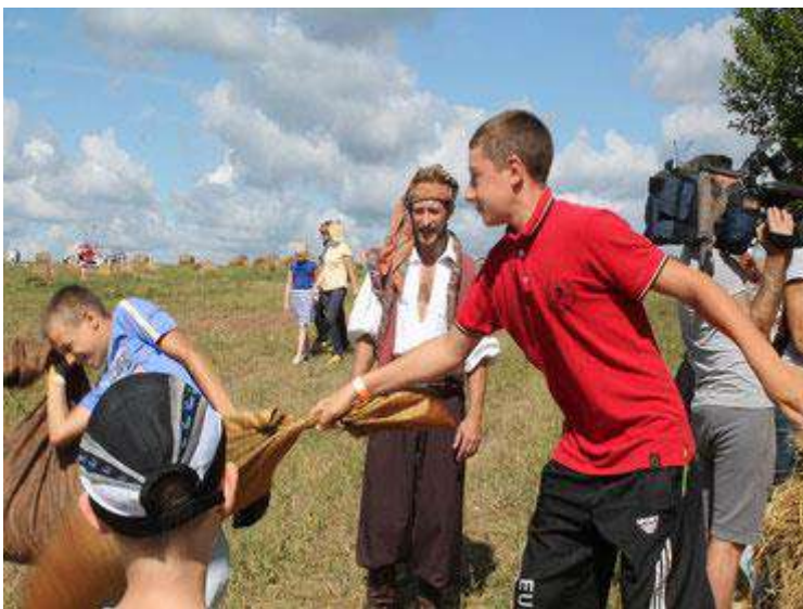
Акция "Подросток и игла" (II рейд)