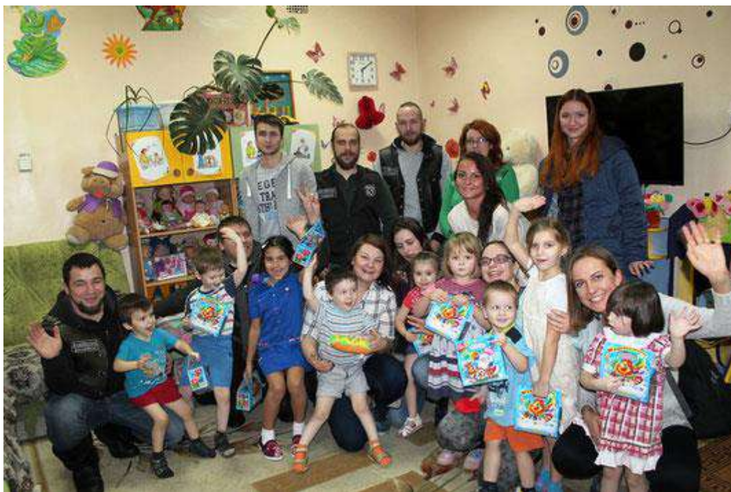
Шефы из уголовного розыска поздравили воспитанников