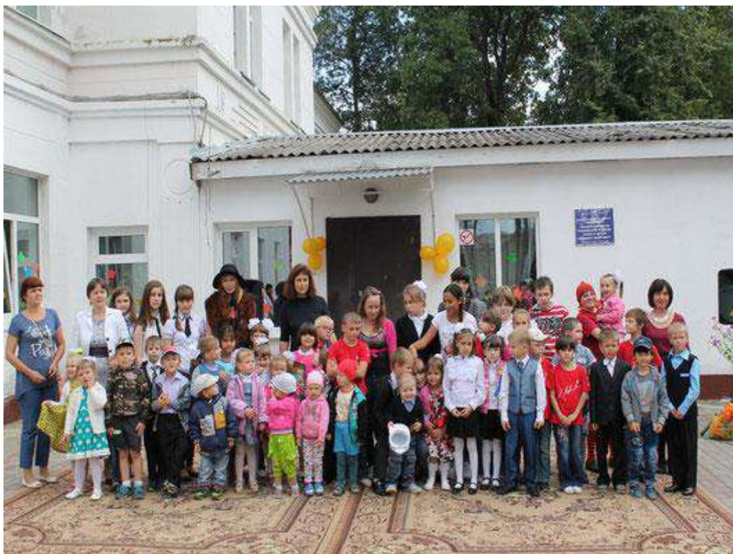
"Выпускной в Школе приемных родителей"