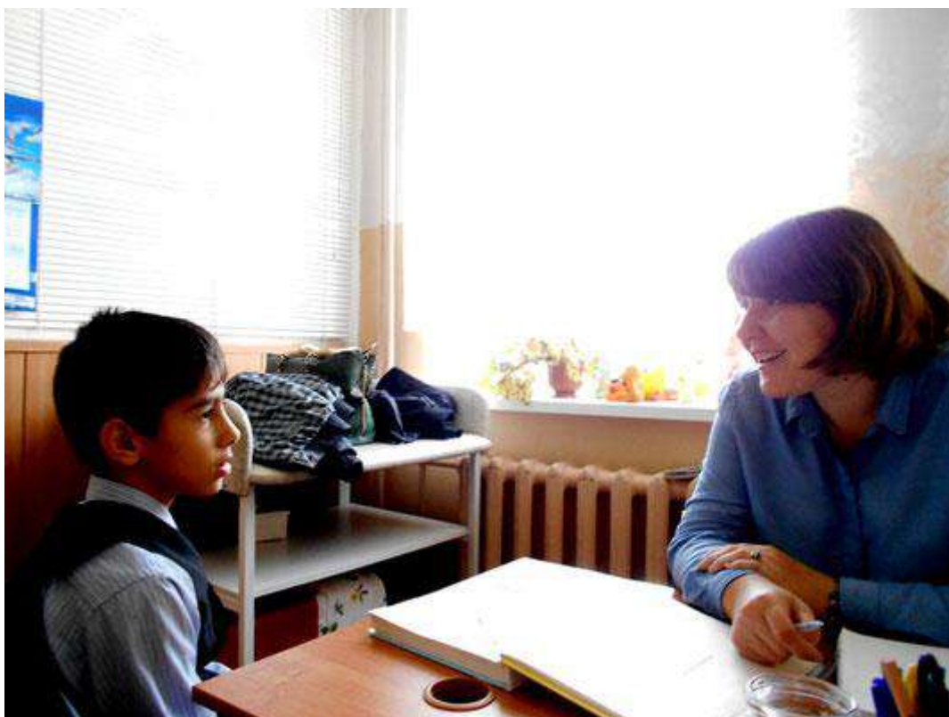
Участники Международного семинара познакомились с центром «Паруса надежды»

21-23 сентября 2016 года в Калужской области проходил IV международный семинар руководителей ветеранских организаций служб уголовного розыска России