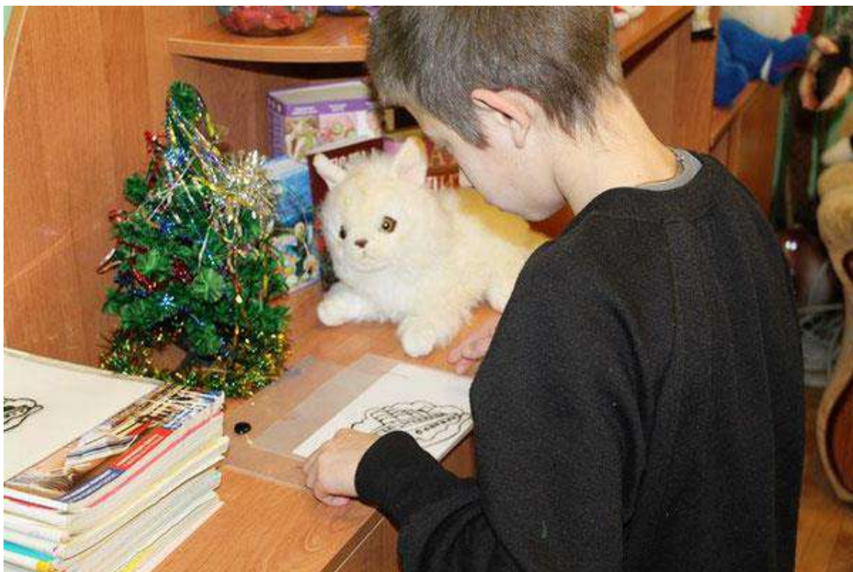
Гости из Шайковки

13 января 2016 года в гости к воспитанникам Кировского центра «Паруса надежды» приехала группа волонтеров из поселка Шайковка чтобы поздравить детей с наступившим Новым 2016 годом.