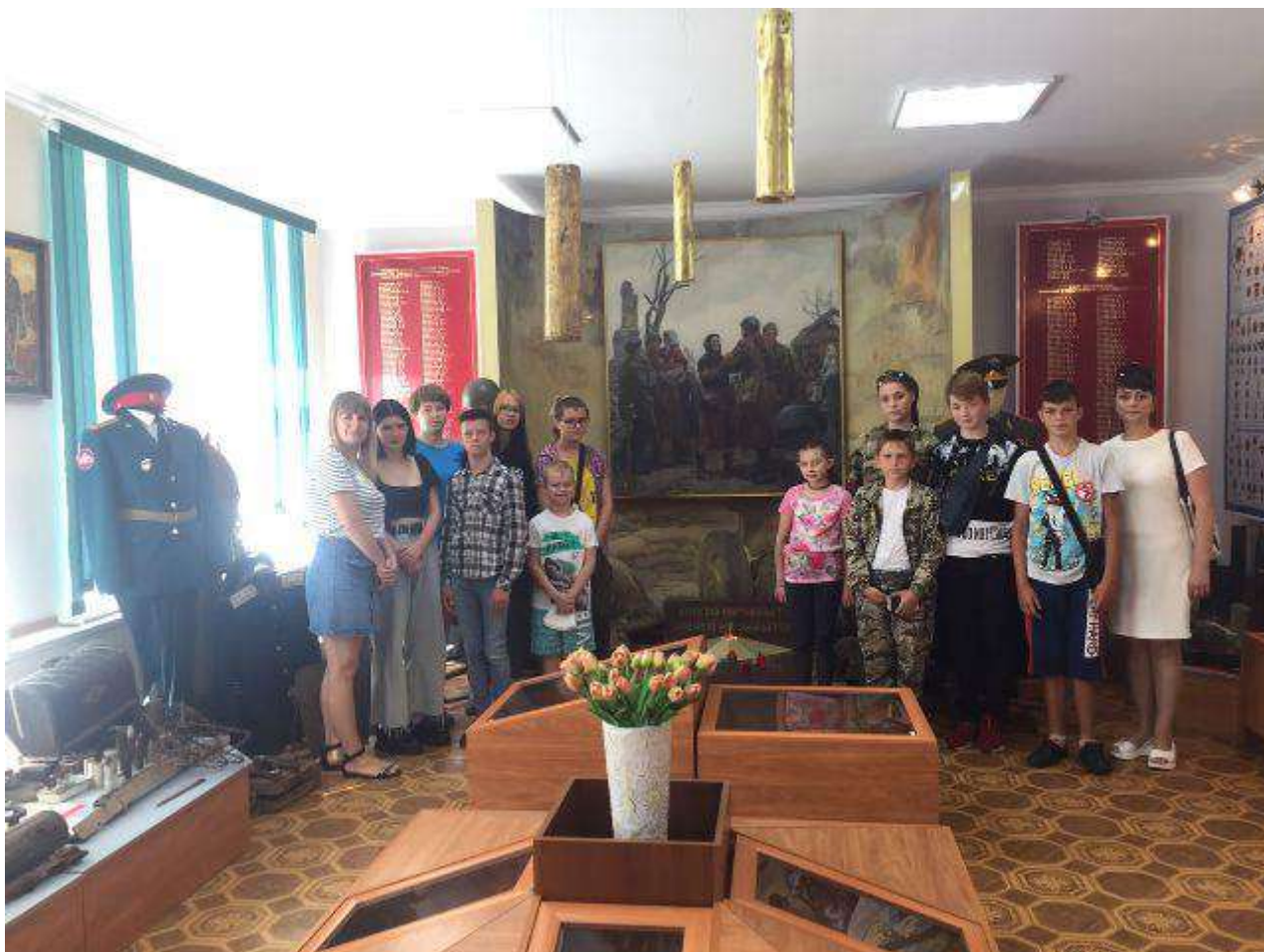
«Первым делом, первым делом самолеты...»