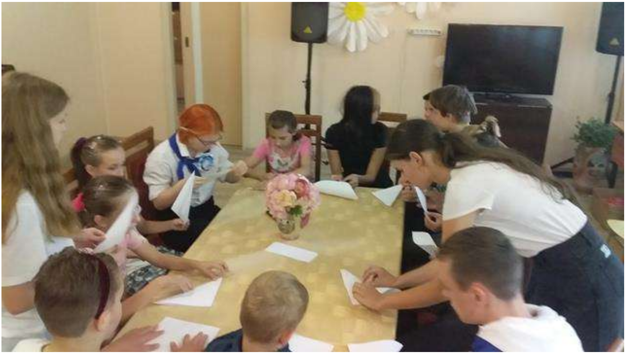
Встреча с настоятелем Храма