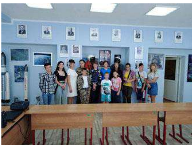
17.08.2021 г. состоящие на обслуживании в ГБУ «Кировский ЦСПСД «Паруса надежды» дети, в рамках акции «Неделя патриотизма» посетили Воскресенскую школу имени Героя Советского Союза М.В. Угарова.