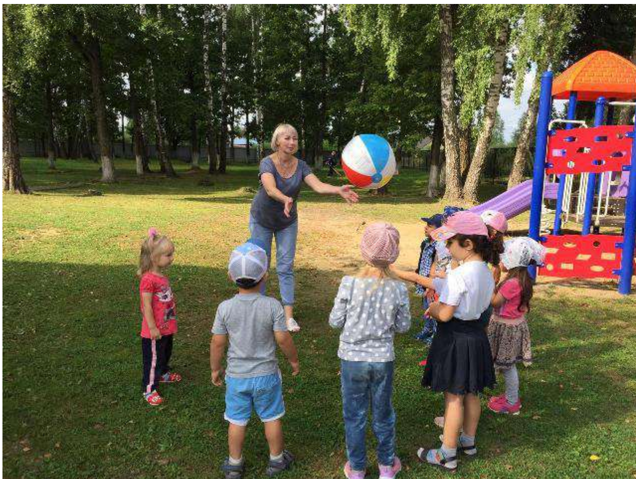
Экскурсия в Воскресенскую школу имени Героя Советского Союза М.В. Угарова.