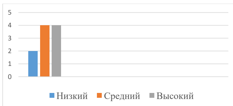
Рисунок 2 - Уровень сформированности познавательного интереса обучающихся 4 «Б» класса

Таким образом, контрольный срез показал, что лишь 20% обучающихся имеют низкий уровень познавательного интереса, 40% - средний, 40 % - высокий.