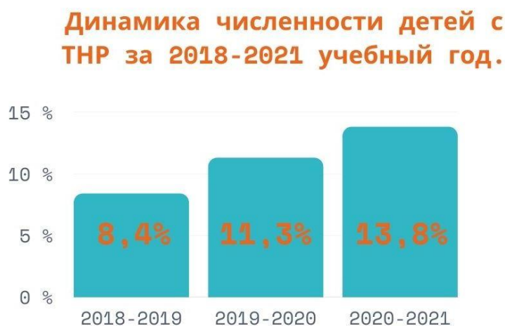
Таблица №1. Динамика численности детей с ТНР от общей численности воспитанников в МБДОУ «Детский сад №14» за 2018-2021 учебный год.

В Учреждении открыты 2 возрастные группы компенсирующей направленности для детей с ТНР, но в логопедической помощи нуждается гораздо больше воспитанников, чем количество мест в данных группах. Концепция инклюзивного образования дает Учреждению возможность обеспечить всех детей коррекционной помощью в логопедических пунктах и реализовать адаптированные образовательные программы.