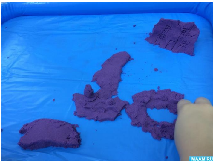
Путешествие в поисках сокровищ