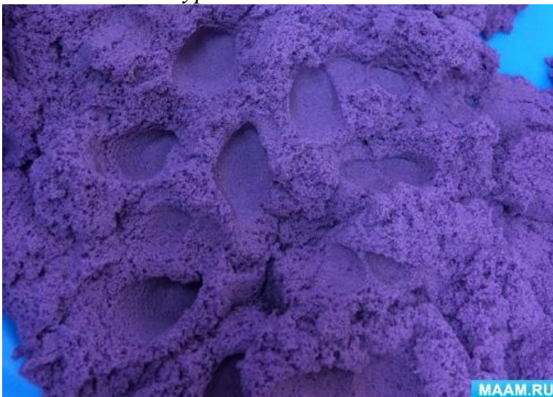
Следы (пальчики ходили, много наследили.)