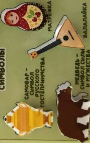
САМОВАР - СИМВОЛ РУССКОГО ГОСТИПРИИМСТВА