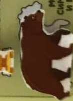
МЕДВЕДЬ - СИМВОЛ СИЛЫ И МУЖЕСТВА