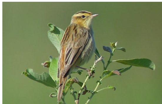
Figure 4 - The aquatic warbler

The aquatic warbler is the rarest and the only internationally threatened passerine bird. The aquatic warbler it is insectivorous, but will take other small food items, including berries. This small passerine bird is a species found in wet sedge beds. Drainage has meant that this species has declined.