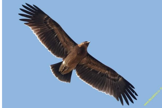
Figure 3 - The greater spotted eagle

quite rare, with populations being harmed primarily by habitat destruction by humans.