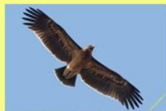
3 the greater spotted eagle (большой подорлик)