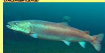
5 the taimen (таймень)

But! We have to protect not only all endangered species of animals, but also all other ones.