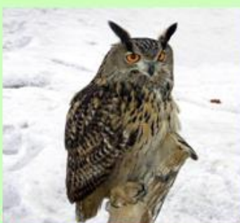
2 the eagle-owl (филин)