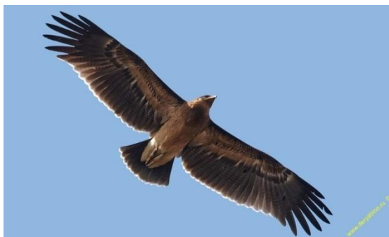
Рисунок 3 – Большой подорлик

грызунами. Большой подорлик встречается довольно редко, его популяции страдают в первую очередь от разрушения среды обитания