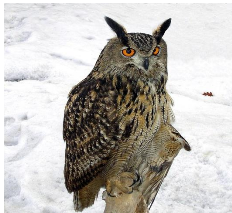
Figure 2 - The eagle-owl

The eagle-owl it is one of the largest species of owl. This bird has distinctive ear tufts. This eagle-owl is a mostly nocturnal predator, hunting for a range of different prey species. The eagle owl population is constantly declining due to human activities.