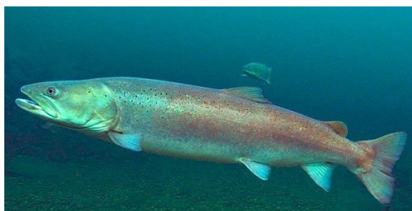
Рисунок 5 – Таймень

Таймень является крупнейшим лососем в мире. Взрослые таймени в основном являются рыбадными, хотя они часто поедают наземную добычу, такую как грызуны и птицы. Этому виду нанесен серьезнейший ущерб из-за неконтролируемого вылова.