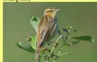
4 the aquatic warbler (вертячая камышовка)