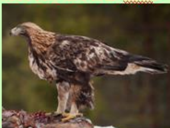
1 the golden eagle (беркут)