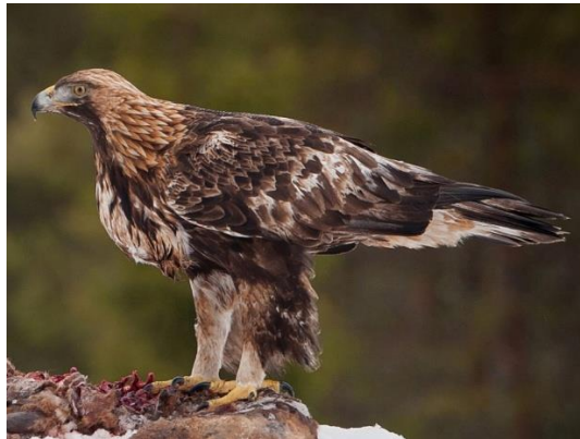
Figure 1 - The golden eagle

The golden eagle is a bird of prey. Golden eagles use their agility and speed combined with powerful feet and large, sharp talons to hunt a variety of prey, mainly hares, rabbits. It has disappeared from many areas that are heavily populated by humans.