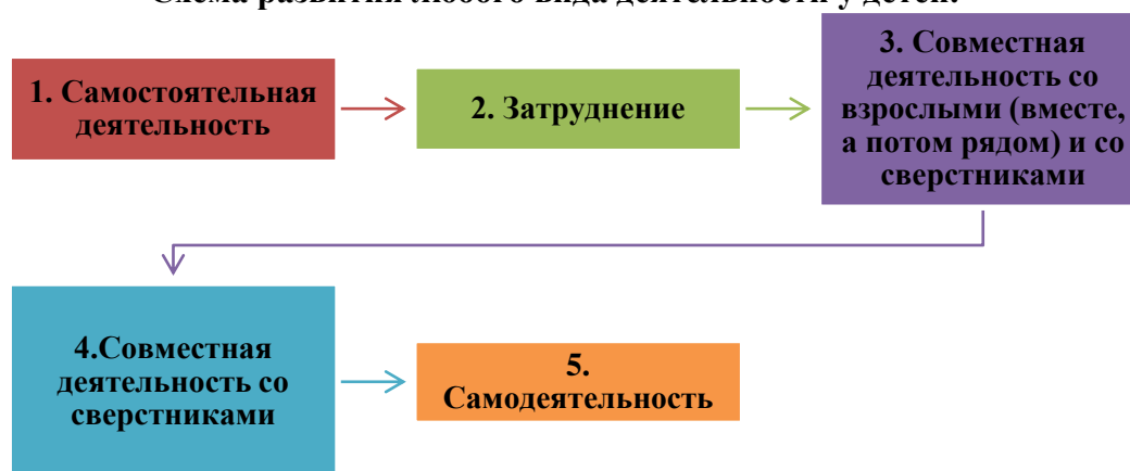
Схема развития любого вида деятельности у детей.