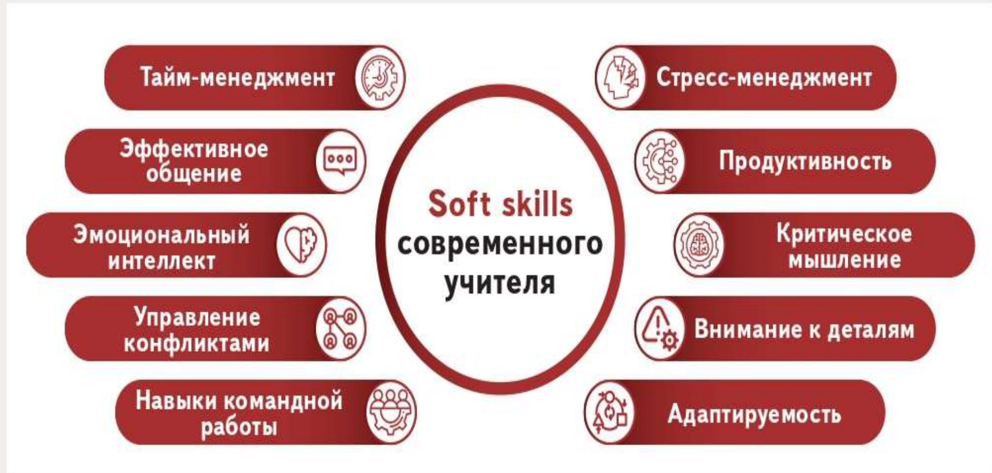
Рисунок 1. Востребованные гибкие навыки педагога