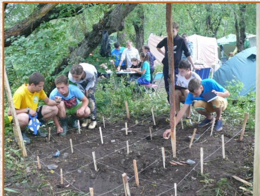
Полевая археология: план раскопа