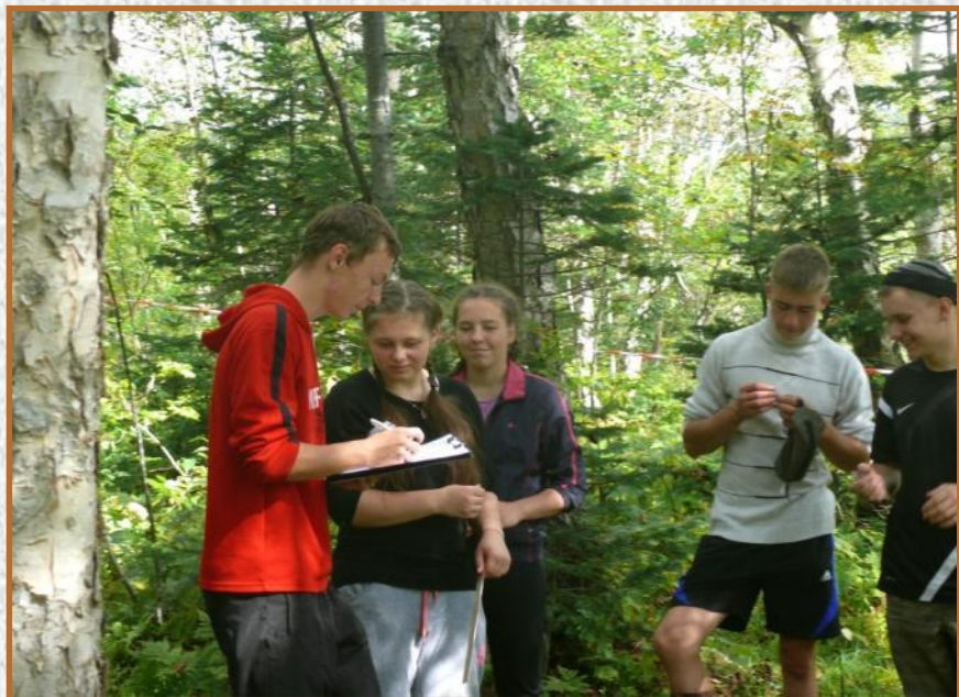
Геоботаника: описание растительности