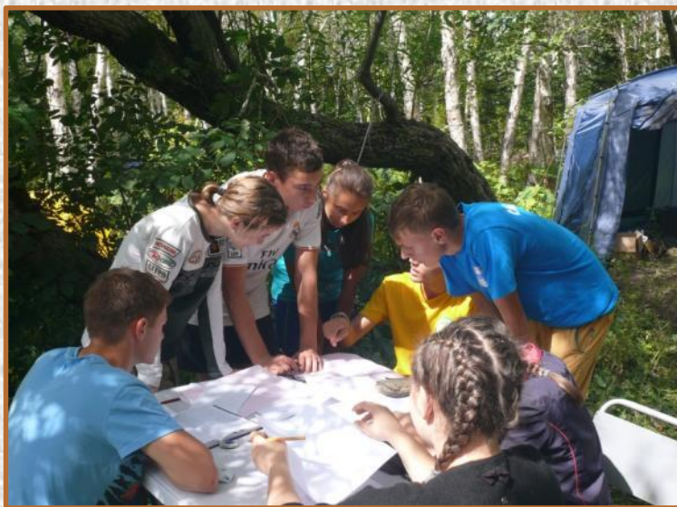
Полевая археология: рисунок