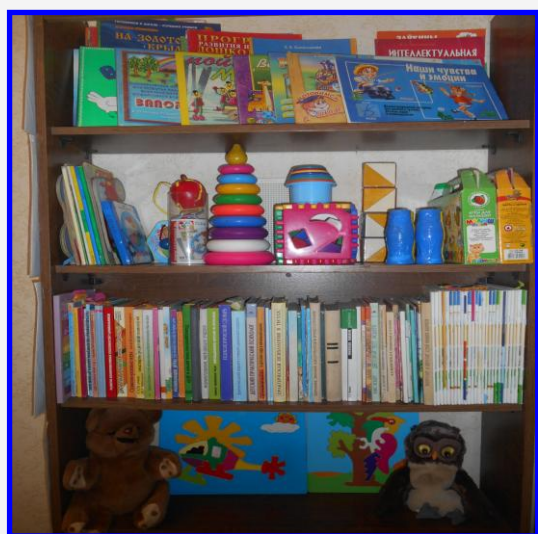
Стеллаж с методическими пособиями и литературой