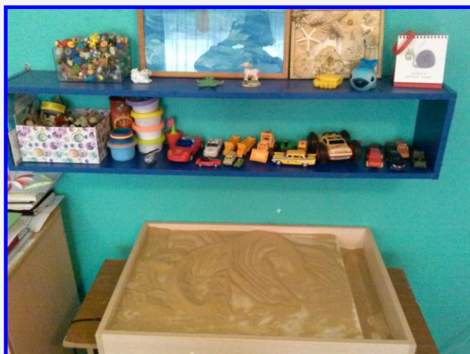
Световой стол с игровым оборудованием