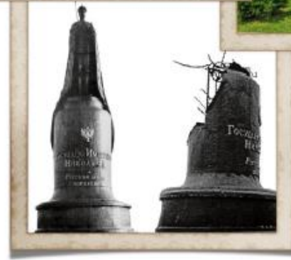
ПАМЯТНИК ЦАРЮ НИКОЛАЮ 2