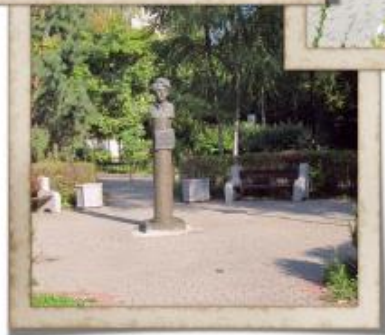
ПАМЯТНИК ПИСАТЕЛЮ КЕДРИНУ