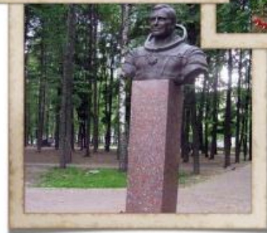
ПАМЯТНИК КОСМОНАВТУ СТРЕКАЛОВУ