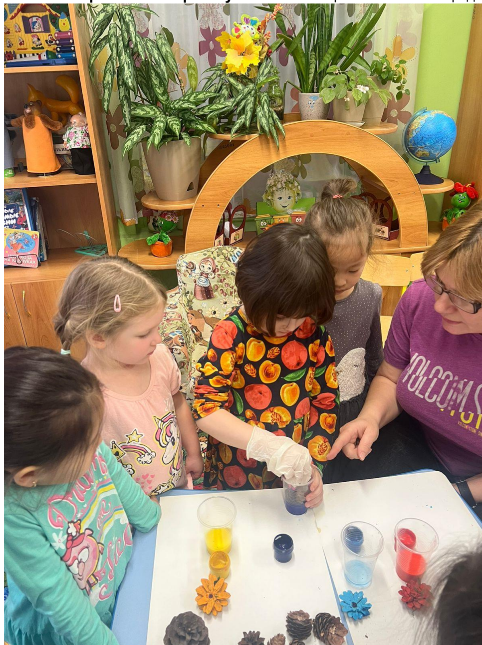
Фотоотчет работы по проекту: Коллективная работа «Символ города - Ладья»