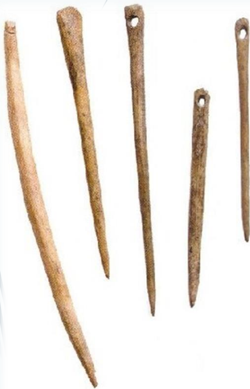
Иглы для вязания IX-X вв. Турсо.