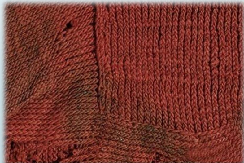
Египет. Фрагмент носка. IV-VI вв. н.э.