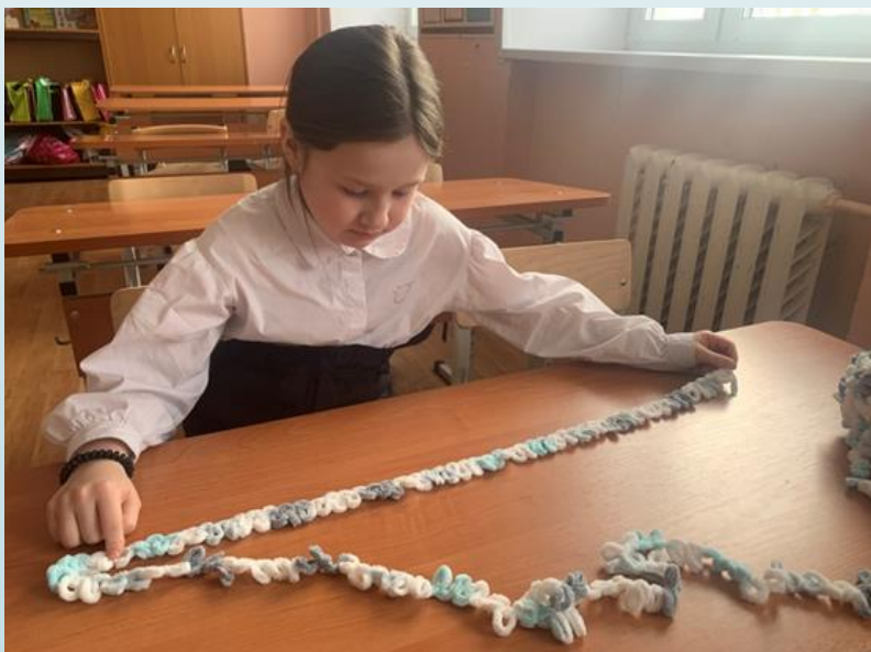
Набор 80 петель