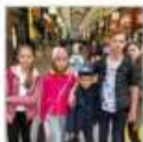
На пешеходной улице Тануси

По-настоящему летняя солнечная и жаркая погода добавляет сахалинцам удовольствия от прогулок по живописному Саппоро. Соседство современной и традиционной архитектуры, своеобразие японских магазинов и пешеходных зон, дизайн уютных темных кафе, колоритный внешний облик жителей и гостей города — все это детали одной большой мозаики Саппоро, не случайно ставшего туристским центром Хоккайдо.