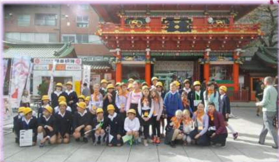
Поощрительная поездка в Токио в составе делегации Сахалинской области (приз собеседования с губернатором О.Н. Кожемяко). Ноябрь 2017 г.