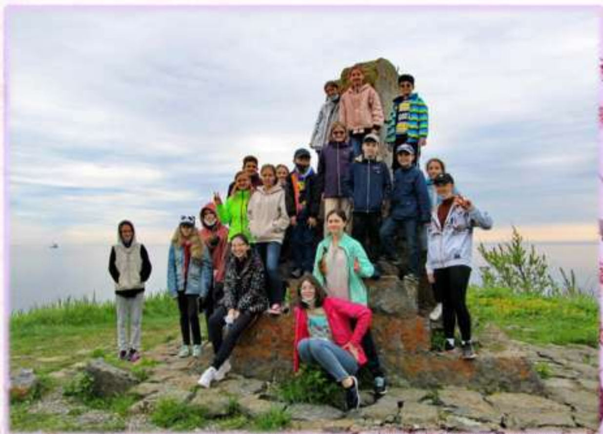
Экскурсия в Пригородное, Корсаковский район. Стела в память о высадке японского десанта на берег Южного Сахалина 07 июля 1905 г. - «Карафута Энсей Гуц Дзёрику Кинэнхи»

Походы – отличное средство для сплочения команды, они помогают нашим учащимся освоить технику безопасного нахождения и самообслуживания в природной среде, получить навыки ведения экскурсии и работы проводника на маршруте. Полученные в походах знания и полевые материалы всегда могут пригодиться для участия в туристско-краеведческих конкурсах, разработки учебных экскурсий или выполнения специальных школьных заданий, а еще лечь в основу беседы с гостями нашего объединения – в том числе и на японском языке.