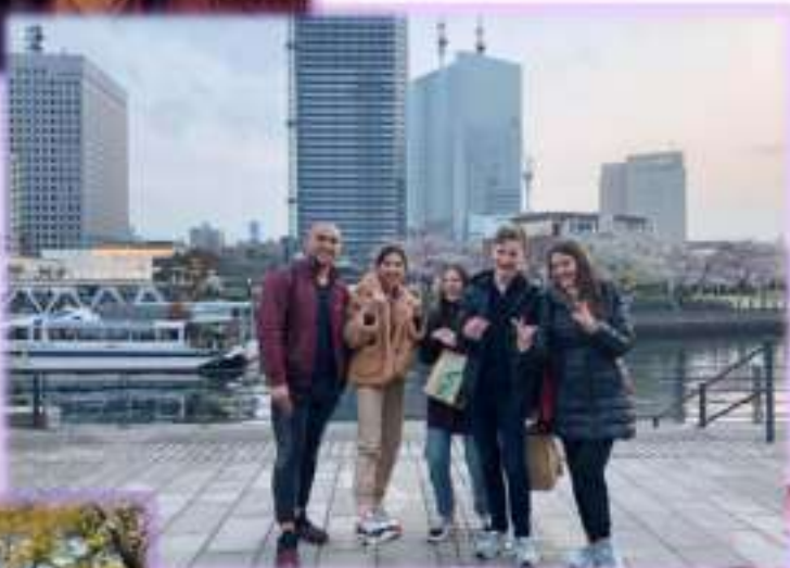
Токио, район Йокосука