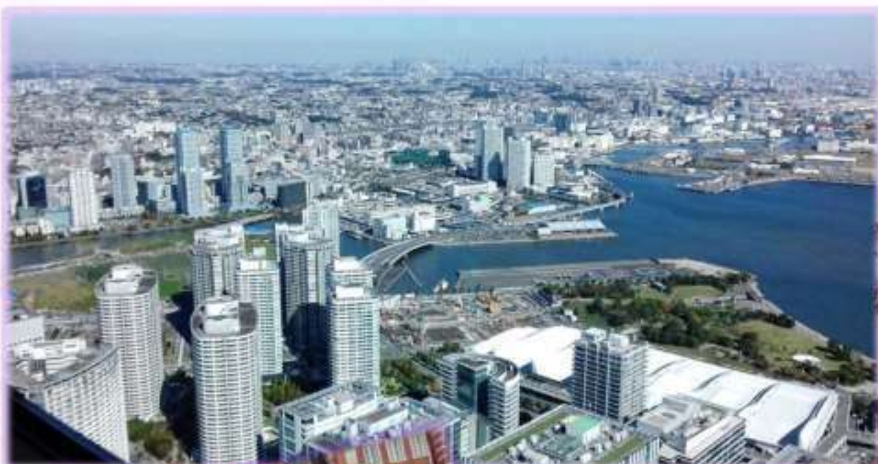
Токио, 2017 г.