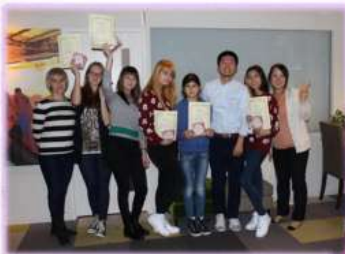
В международной академии IAY International Academy, г. Саппоро. 2015 г.