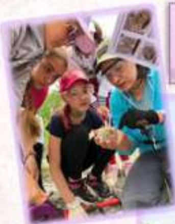
Краеведческая экспедиция в долину реки Владимировки. Окрестности Южно-Сахалинска