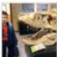
В музее университета Хоккайдо