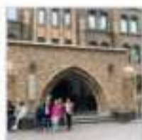
Главный вход в музей университета Хоккайдо

Одним из самых запоминающихся стали для ребят экскурсии в Хоккайдский университет. Будучи основан в 1872 году как сельскохозяйственный колледж, сегодня он является одним из 7 национальных университетов Японии и служит своим научным музеем (The Hokkaido University Museum). Его залы хранят множество экспонатов — от предметов, иллюстрирующих основные научные отрасли, которыми занимается университет, до археологических находок, этнографических коллекций и палеонтологических динозавров. Туристы могут встретить здесь самых неожиданных обитателей доисторических островов, например, шерстистого мамонта, который водился и на Сахалине, или настоящего (и единственного в мире) сахалинского динозавра — ниппонозавра, которого японцы обнаружили в районе современного Синьотори еще в 1934 году и привезли сюда для изучения.