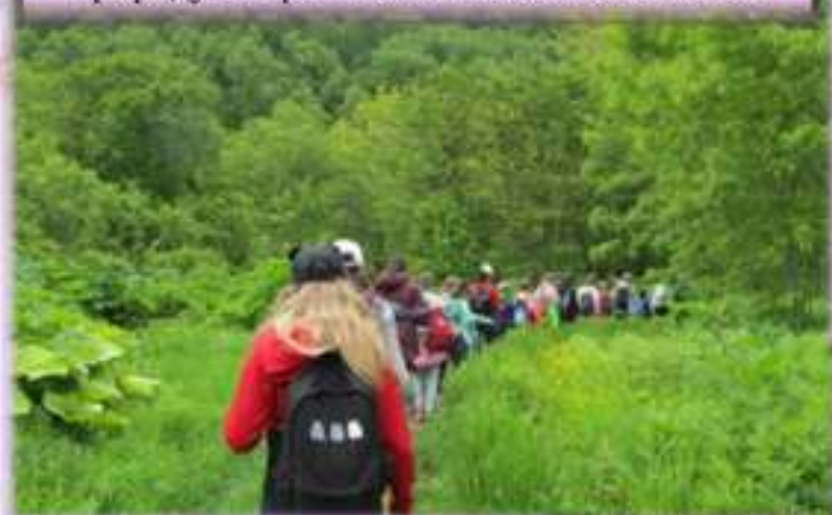
Прогулки в долину реки Рогатки. Изучаем природу в окрестностях Южно-Сахалинска