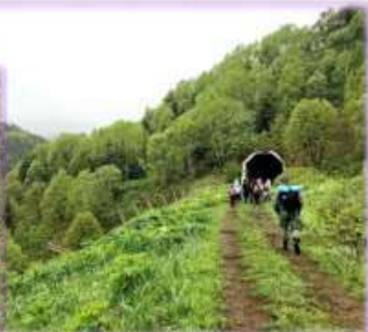
Поход на Южно-Сахалинский грязевой вулкан. Тоннельная железная дорога «Южно- Сахалинск-Холмск (Тойохара-Маока)»