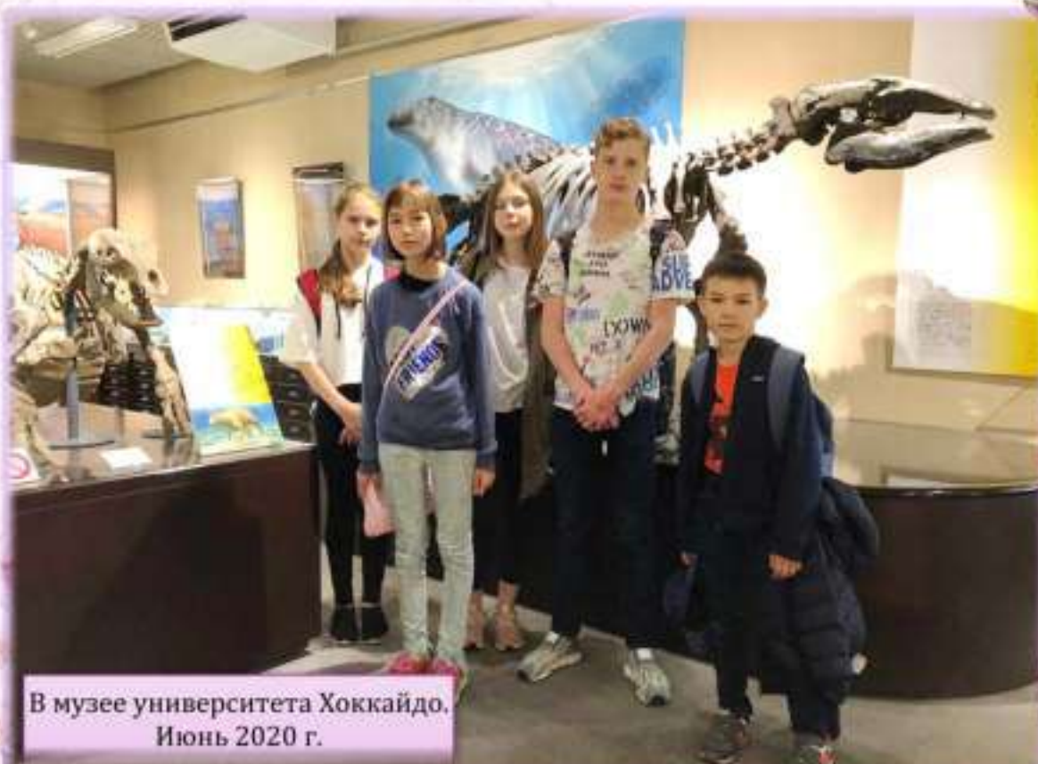
В музее университета Хоккайдо. Июнь 2020 г.