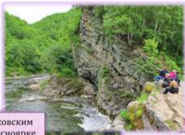
Путешествие к Быковским порогам на реке Красноярке, Долинский район