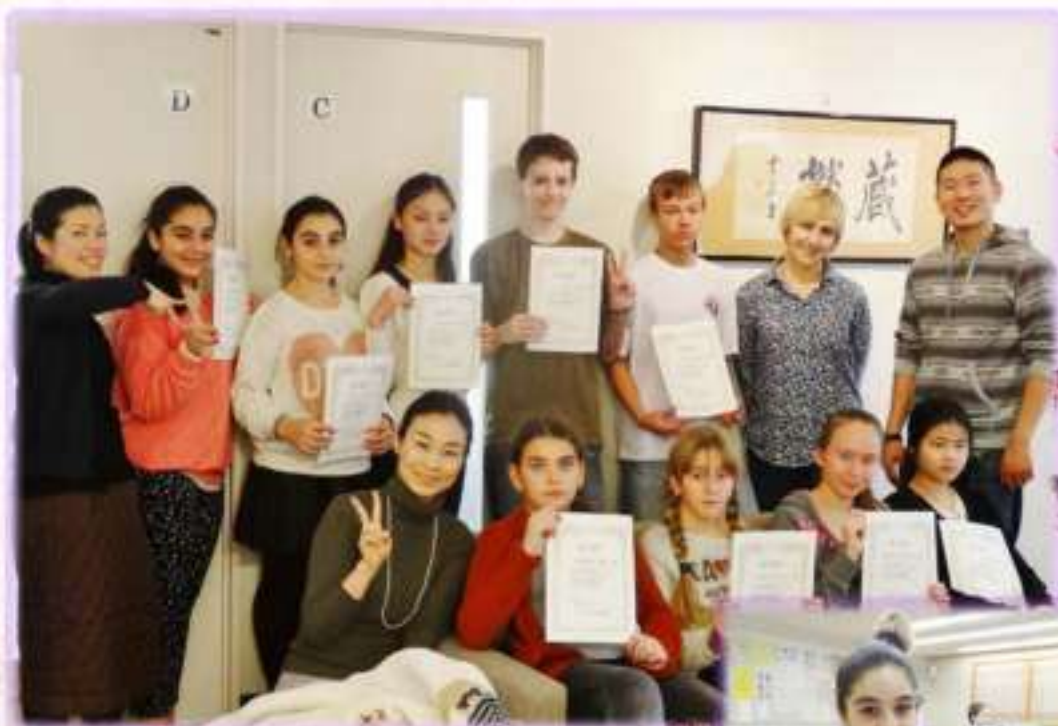
Hokkaido Japanese Language School. Ноябрь 2013 г.

В составе выездной группы обычно бывает до 12 детей, но остальные ребята в это время всегда имеют возможность дистанционного присутствия на занятиях. Туристско-образовательные поездки в Японию не только помогают детям углубить знание японского языка, но и дают отличную возможность применить его на практике, расширяют географический и культурный кругозор учащихся, способствуют развитию коммуникативных навыков и социализации.