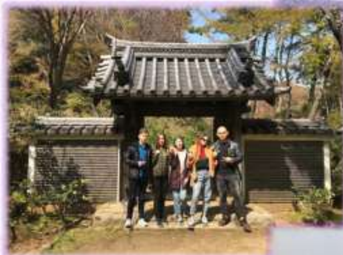
Токио, храм Синагава