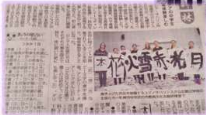
Национальная газета Японии «Майничи Симбун» - заметка об участии наших ребят в мастер- классе знаменитых сэнсеев