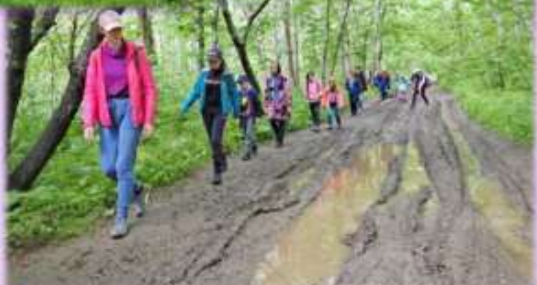
Один из наших любимых туристско-краеведческих маршрутов – экотропа «Северное кольцо» в окрестностях Южно-Сахалинска