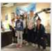
Исследование морские млекопитающие

Интересным и разнообразным получился поход в музей губернаторства Хоккайдо. Здесь каждый найдет для себя чем восхищаться, будь то старинная архитектура здания или уникальные экспонаты, представляющие историю острова от древних времен до наших дней, а кому-то больше всего понравятся знаменитые люди, населившие перепалки, карпаки и утиски.