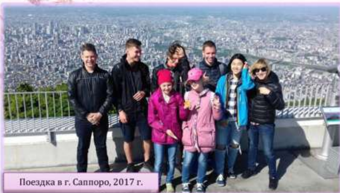
Поездка в г. Саппоро, 2017 г.