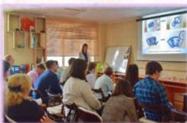
Открытые краеведческие чтения ЦДЮТ памяти А.С. Челнокова