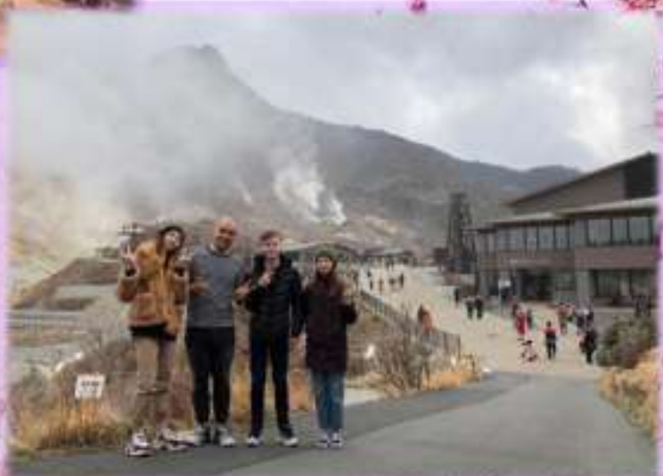
На склоне горы Фудзи. Национальный парк Фудзи-Хаконе-Идзу