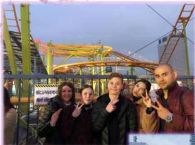
Путешествие в Токио. Март 2019 г.