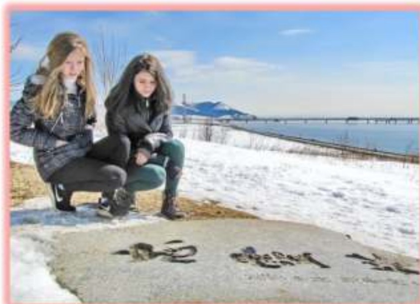
Пригородное, долина реки Мерея. Вид на завод по производству СПГ