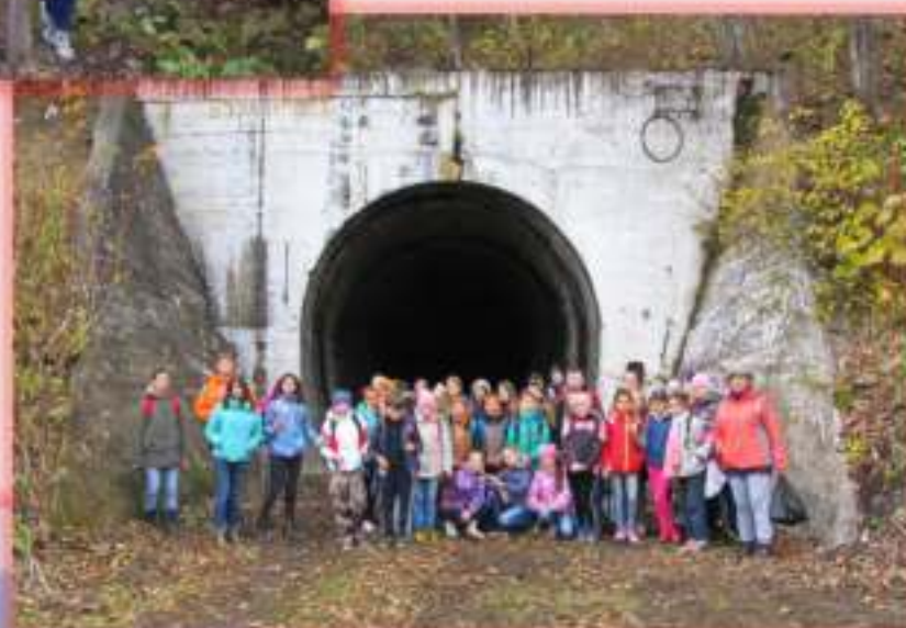
Тоннельная железная дорога «Южно-Сахалинск-Холмск»