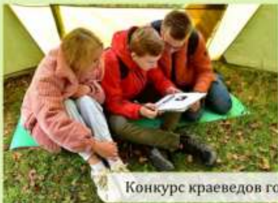
Конкурс краеведов городского турслёта школьников