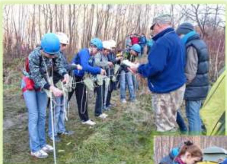
Традиционные осенние соревнования ЦДЮТ по технике пешеходного туризма