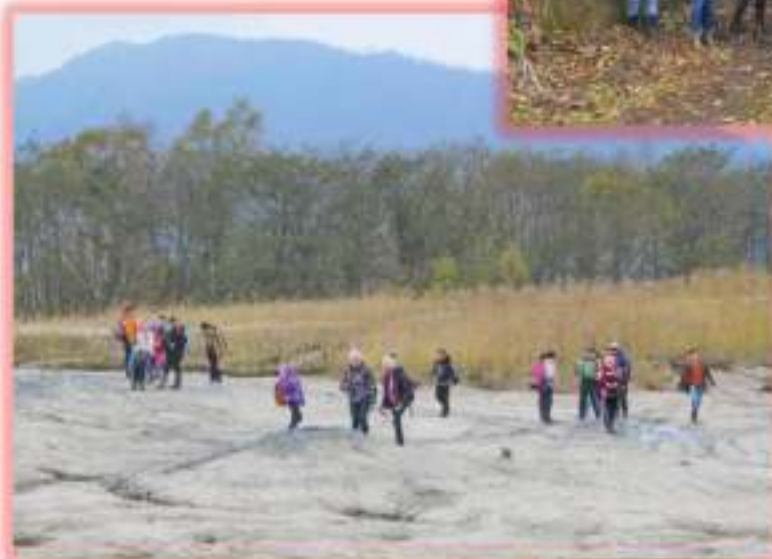
Памятник природы - грязевой вулкан «Южно-Сахалинский»