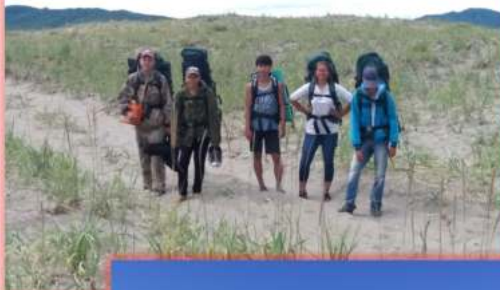
Мыс Слепиковского, Холмский район

В течение всего учебного года и на летних каникулах ребята нашего объединения не раз бывают в походах или отправляются в поездки к различным туристским достопримечательностям. Маршруты разнообразны: от прогулок и походов выходного дня в ближайших окрестностях Южно-Сахалинска до многодневных путешествий по живописным местам Южного Сахалина. Походы, полевые экскурсии, дальние поездки дают отличную возможность лучше узнать географию, флору и фауну, историю нашего острова, отточить туристские навыки и умения, сплотить команду.