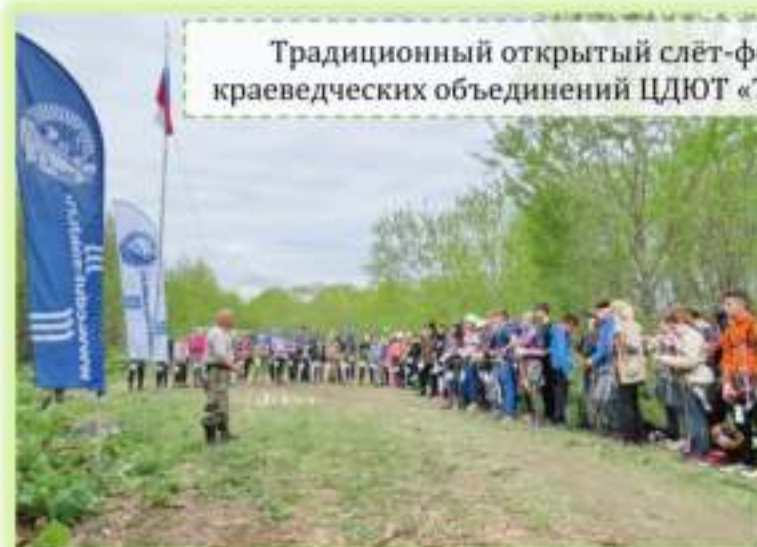
Традиционный открытый слёт-фестиваль туристско-краеведческих объединений ЦДЮТ «ТЕРРИТОРИЯ НЕПОСЕД»