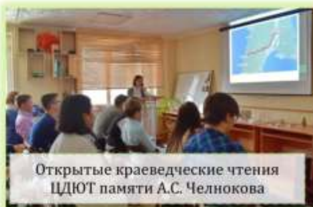
Открытые краеведческие чтения ЦДЮТ памяти А.С. Челнокова