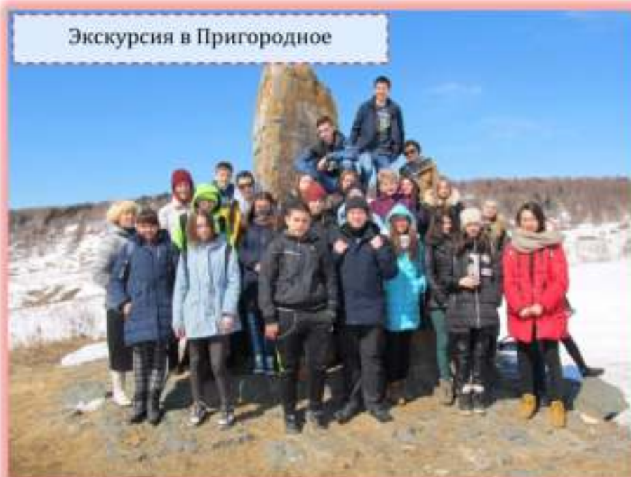
Экскурсия в Пригородное