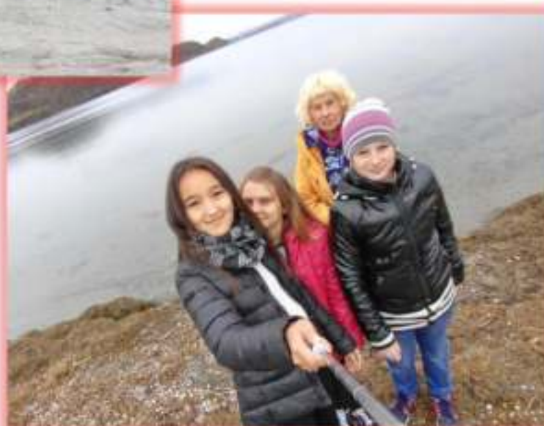
На берегу лагуны Тунайча