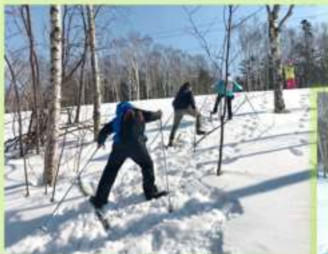
Зимний контрольно-туристский маршрут (КТМ)

Проверить и закрепить всё, чему ребята научились за время занятий и походов, помогают различные мероприятия. В первую очередь, это традиционные, много лет проводящиеся нашим Центром соревнования, викторины и конкурсы, однако и новые необычные вызовы юные туристы-краеведы встречают с энтузиазмом. Наши ребята часто становятся их победителями и призёрами, получают ценный опыт, используют его в школе, повышают свою мотивацию к туристско-краеведческой работе.