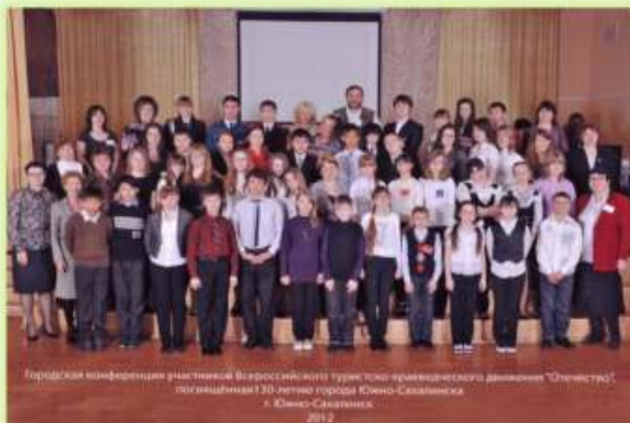
Городская краеведческая конференция школьников «ОТЕЧЕСТВО»