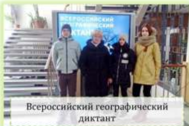
Всероссийский географический диктант