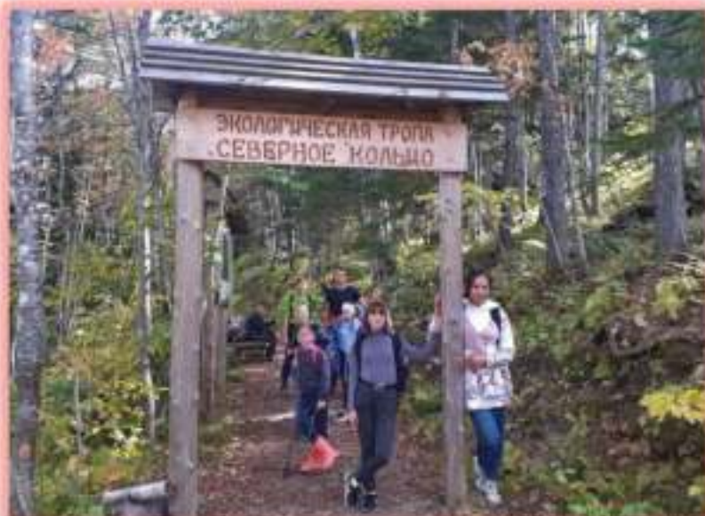
Экотропа «Северное кольцо» на склоне горы Большевик – маршрут постоянных экскурсий в природу и полевых практик