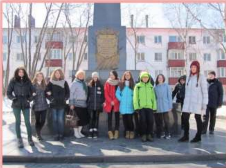
Знакомство с городом Корсаков