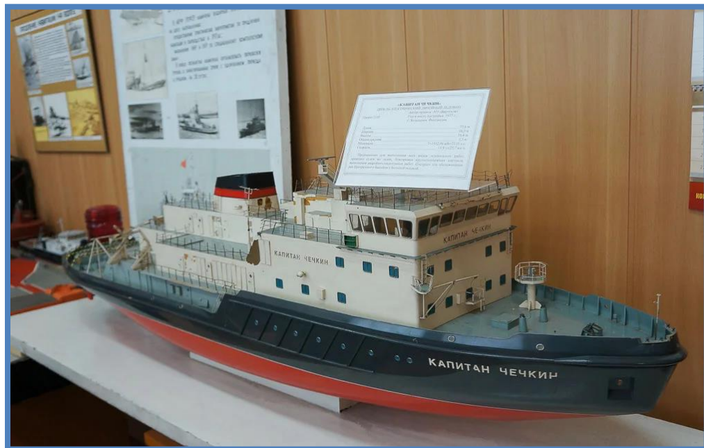
Капитан Чечкин - линейный ледокол проекта 1105 (тип "река-море")