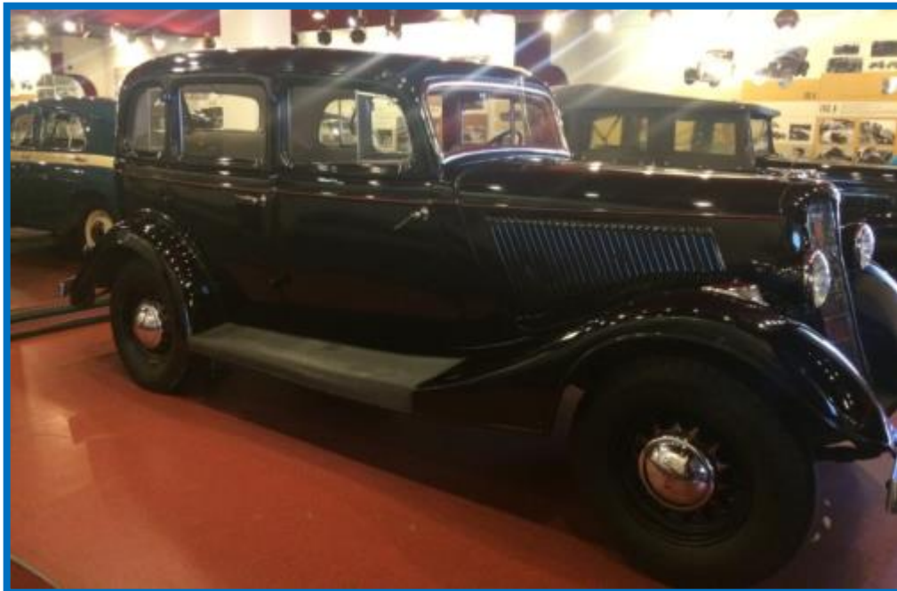
Автомобиль ГАЗ М-1 «Чёрный воронок»