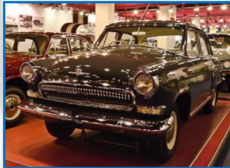
АЗ М-21 "Волга".