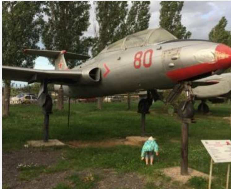
Это Чехословацкий учебно-тренировочный Л-29