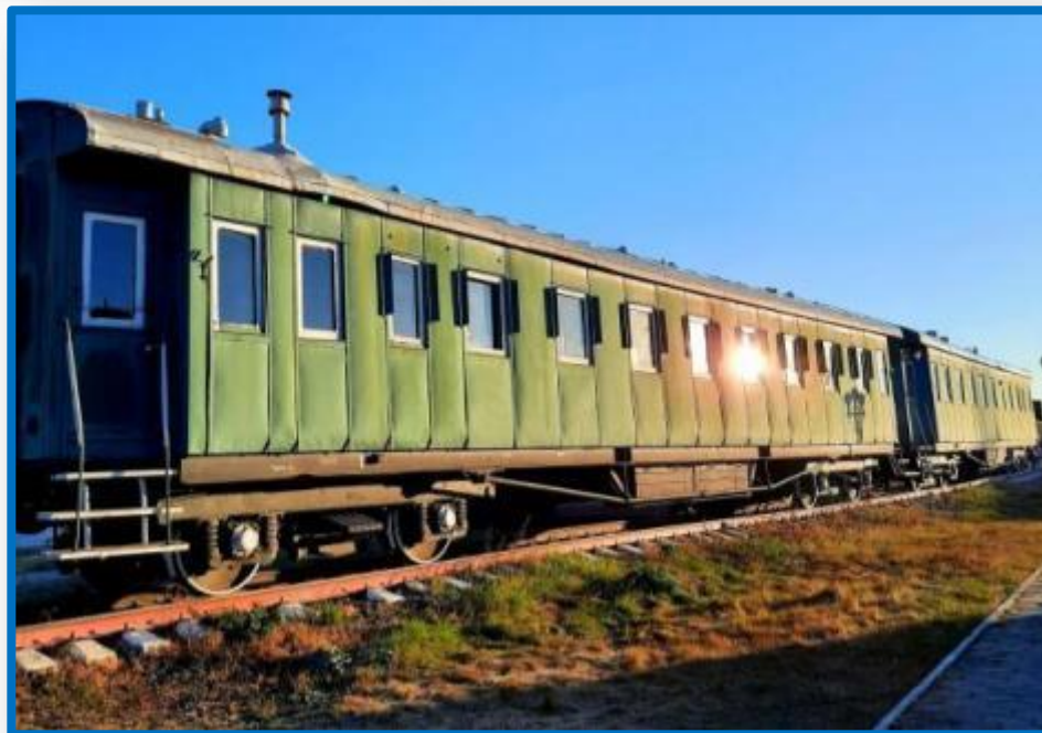
Пассажирский состав царских времен