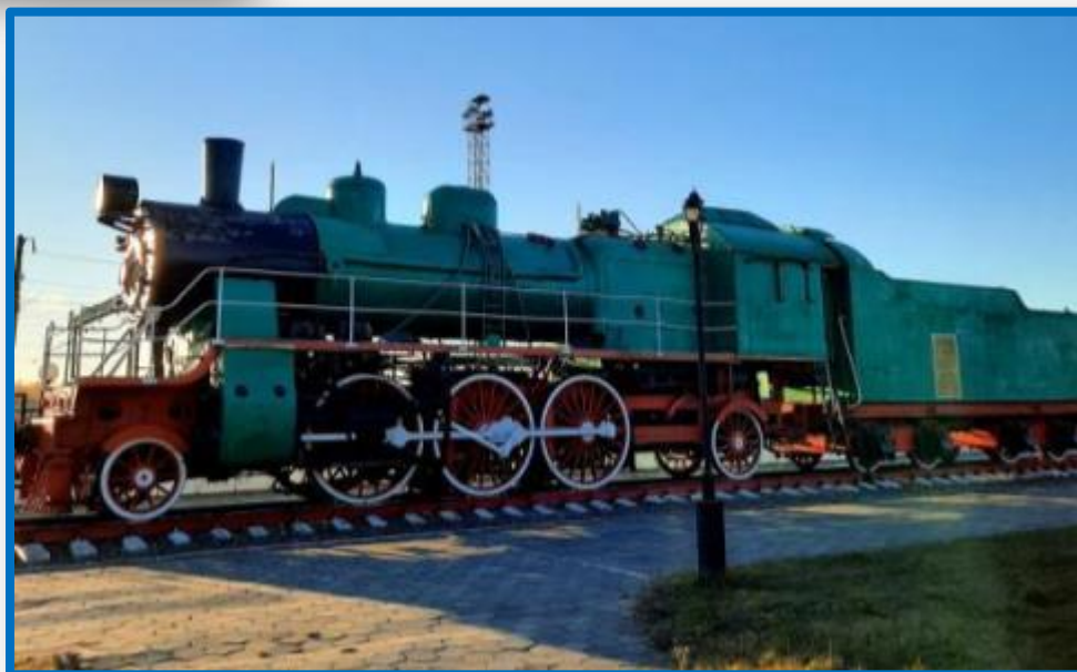
Паровоз серии Су выпускался на заводе «Красное Сормово»