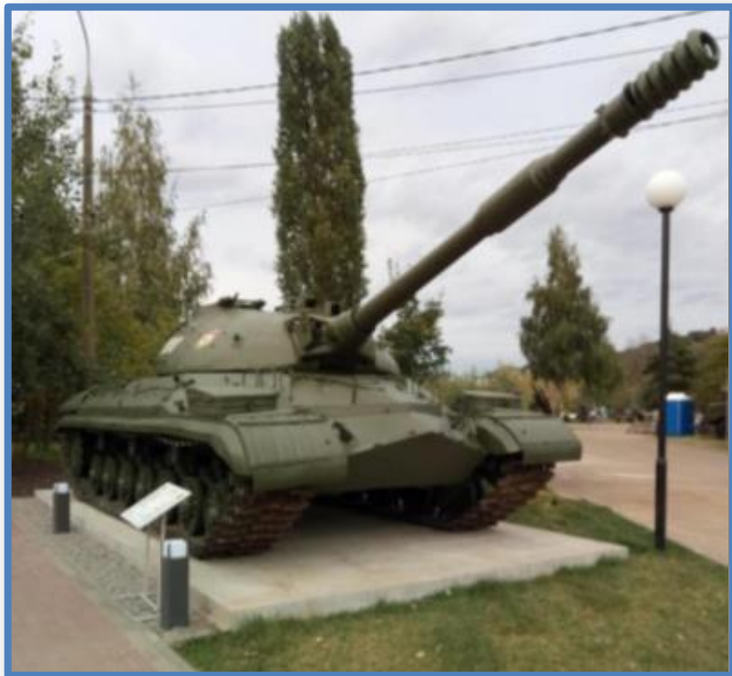
Тяжёлый танк Т-10М