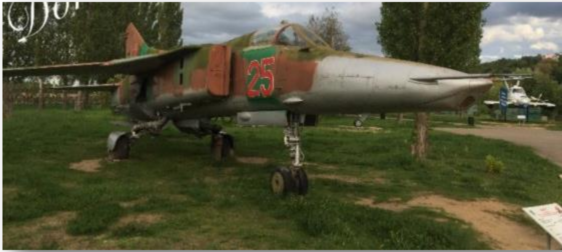
Это истребитель-бомбардировщик 3-го поколения МиГ-27