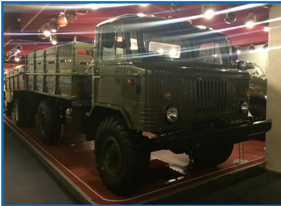
Легендарный легкий армейский грузовик ГАЗ-66