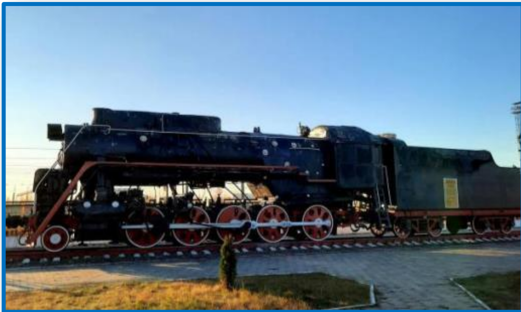
Грузовой паровоз серии Л