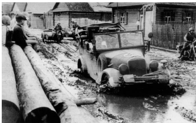
Вход вермахта в захваченную Вязьму 6 октября 1941 года.

В ночь на 6 октября было принято решение об отводе войск Западного и Резервного фронтов на Ржевско-Вяземский оборонительный рубеж. Начался отход Советских войск, но он оказался запоздалым. Противнику удалось форсировать реку Днепр северо-западнее Вязьмы, а южнее Вязьмы овладеть Спас-Деменском, Кировом и Юхновом, котел захлопнулся.