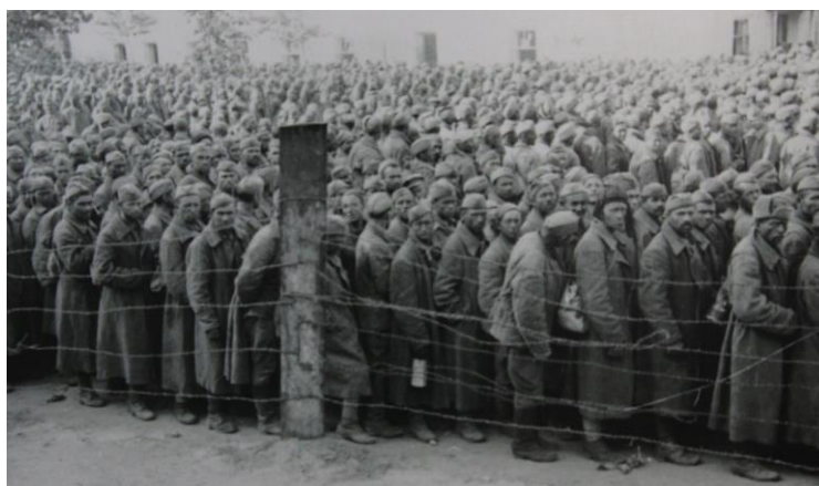
Советские воины и добровольцы-ополченцы из Москвы в немецком пересыльном лагере дулаг № 184 в Вязьме.

Пленные и пропавшие без вести — 450—500 тысяч человек, а общие потери Западного, Резервного фронтов, полевых строителей Западного управления и других гражданских наркоматов он оценивает в 770—925 тыс. чел., попали в плен 663 тысячи.