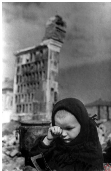
Маленькая жительница Гжатска плачет на пепелище дома