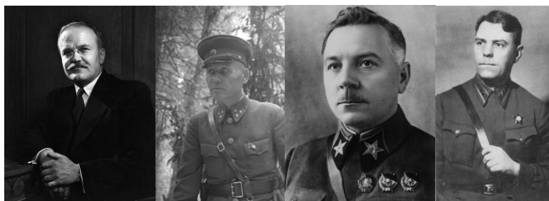
В.М.Молотов, И.С. Конеv, К.Е. Ворошилов, А.М. Василевский.

Эти предложения были одобрены Ставкой. Войска Западного и Резервного фронтов были объединены в один Западный, командующим фронтом был назначен отозванный из Ленинграда генерал армии Г.К. Жуков. Сам Жуков писал об этом так: