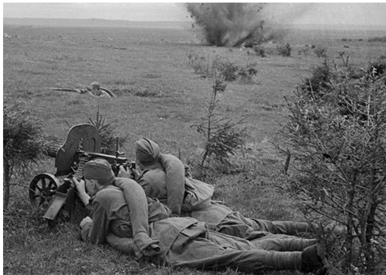
Воины Красной армии ведут бой западнее Дорогобужа. Начало октября 1941 г.

направление прорыва противника и нанести по нему контрудар с целью восстановления утраченного положения. Однако контрудар Западного фронта успеха не имел.