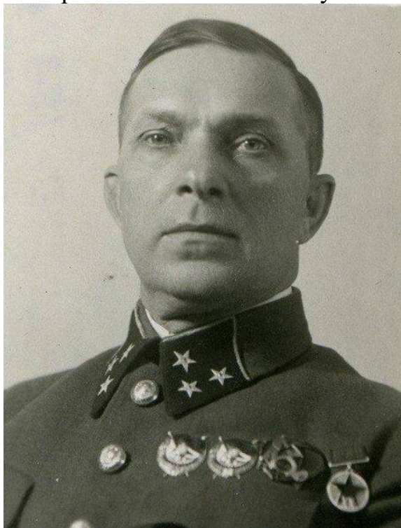
Генерал-лейтенант Михаил Федорович Лукин

7 октября передовые соединения немецких 3-й и 4-й танковых групп замкнули кольцо окружения основных сил 19, 20, 24 и 32-й армий. Окруженным объединениям было приказано прорываться на Гжатск под общим руководством генерал-лейтенанта М.Ф. Лукина.