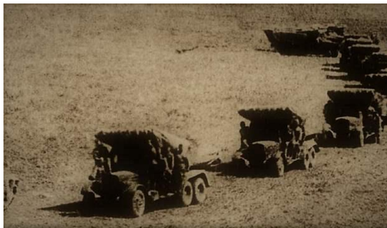
Установки БМ-13 на марше.

боеприпасов, первая батарея «Катюш» также оказалась во вражеском «кольце». Командир батареи делал все возможное, чтобы вывести людей и технику из окружения. Те машины, на которых заканчивалось горючее, взрывались.