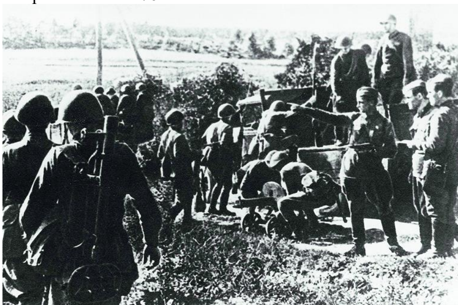
Солдаты 9-ой армии под Вязьмой 1941г.

Там где были созданы укрепления, стянуты вооружённые силы, подготовлены батареи орудий ожидался основной удар. Также для обороны использовались морские тяжёлые орудия, которые прикрывали 800 моряков. Дивизии были хорошо укомплектованы личным составом и вооружены. Плотность защиты была практически рекордной. К примеру, Девятнадцатая армия защищала участок фронта протяжённостью 25 км. У неё было три дивизии (в каждой из которых в среднем по 10 тысяч человек) в первом эшелоне и две – во втором эшелоне обороны. В их распоряжении находилось 56 штук 85-мм зенитных пушек, 90 штук 45-мм орудий и ещё 338 единиц орудий калибром не менее 76 мм.