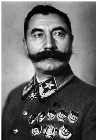
Маршал Советского Союза Семён Михайлович Будённый

Согласно директиве Ставки ВГК от 27 сентября 1941 г., войска Западного фронта под командованием генерал-полковника И.С. Конева в составе 22, 29, 30, 19, 16 и 20-й армий занимали оборонительный рубеж, состоявший из двух полос протяженностью 340 км от Осташкова до Ельни. Фронт имел одноэшелонное оперативное построение. 24-я и 43-я армии из его состава обороняли рубеж от Ельни до железной дороги Рославль – Киров шириной до 100 км. Войска Резервного фронта возглавляемого Маршалом Советского Союза С.М. Буденным.