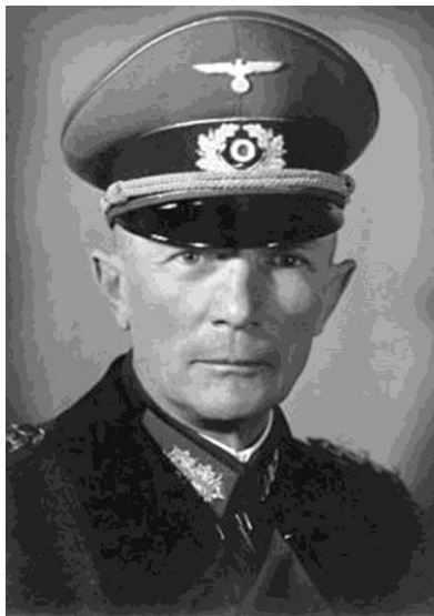
Генерал-фельдмаршал Ф. Бок

Для выполнения поставленной задачи генерал-фельдмаршал Ф. Бок, командующей группой армий «Центр» создавал две мощные ударные группировки. Из района Духовщины наступали основные силы 9-й армии и 3-я танковая группа (пехотных дивизий – 12, танковых – 3, моторизованных – 2, моторизованных бригад – 1), а из района Рославля – основные силы 4-й армии и 4-я танковая группа (пехотных дивизий – 11, танковых – 5, моторизованных – 2).