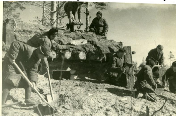
Подготовка оборонительных сооружений под Вязьмой 1941г.

24-я и 43-я армии обороняли рубеж от Ельни до Снопоти шириной до 100 км. 31, 49 и 32-я армии в тылу Западного фронта занимали Ржевско-Вяземский оборонительный рубеж протяжённостью 300 км. 33-я армия, составлявшая резерв фронта, была сосредоточена в районе Спас-Деменска за армиями первого эшелона. Оборона советских войск была неглубокой (15–20 км), слабо подготовленной в инженерном отношении и носила очаговый характер. Готовность Ржевско-Вяземского оборонительного рубежа к началу октября не превышала 40–50% запланированного объема работ.