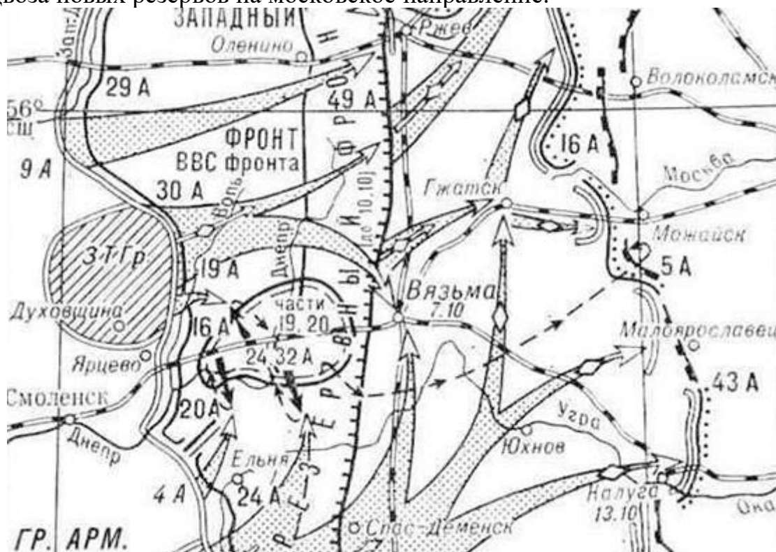
Боевые действия октябрь-ноябрь 1941 года.

Цели и задачи советской стороны: Не допустить прорыва главных сил германской группы армий «Центр» на московском направлении, нанести немецким войскам максимальный урон и выиграть время для формирования и подвоза новых резервов на московское направление.