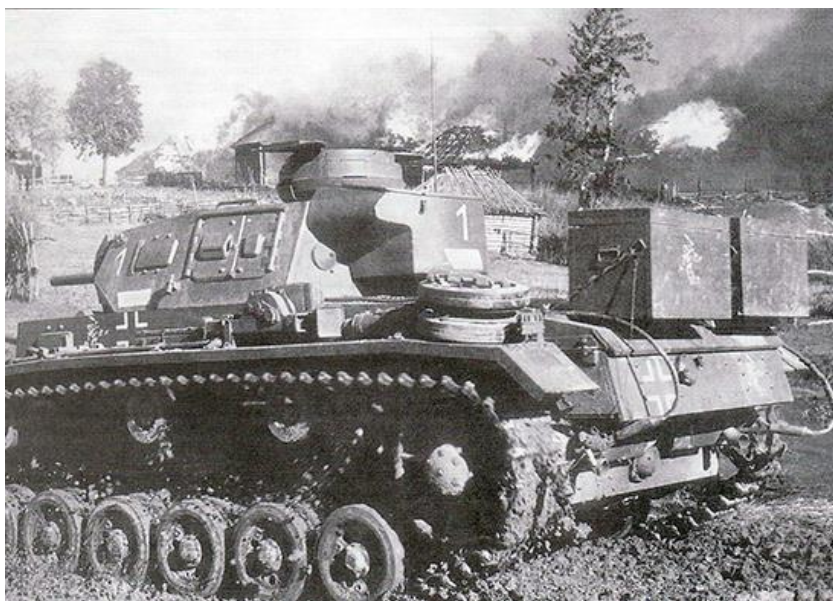
Танки 11-й танковой дивизии вермахта в наступлении. Осень 1941 г.

9-я армия поглядывает одним глазом на фронты XXXII и VIII корпусов, чье наступление не имеет решающего значения, а другим — на свой левый фланг, где армия видит некую призрачную угрозу. Вместо подобного наступления с оглядкой, 9-й армии следовало бы все поставить на карту и сделать попытку прорваться от Холма к Вязьме."