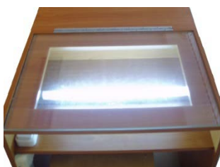
Стол для выжигания

Гильоширование (англ. Guilloche) – отделка изделий ажурным кружевом и изготовление аппликаций выжиганием с помощью специального аппарата раскаленной иглой.