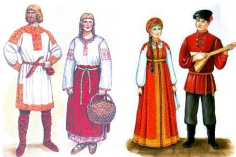
Традиционная одежда русских