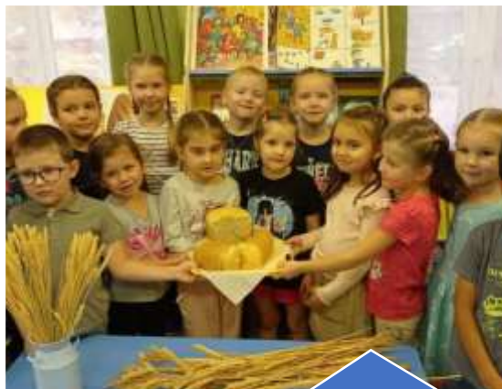
Познавательно - исследовательский проект «Хлеб - всему голова»