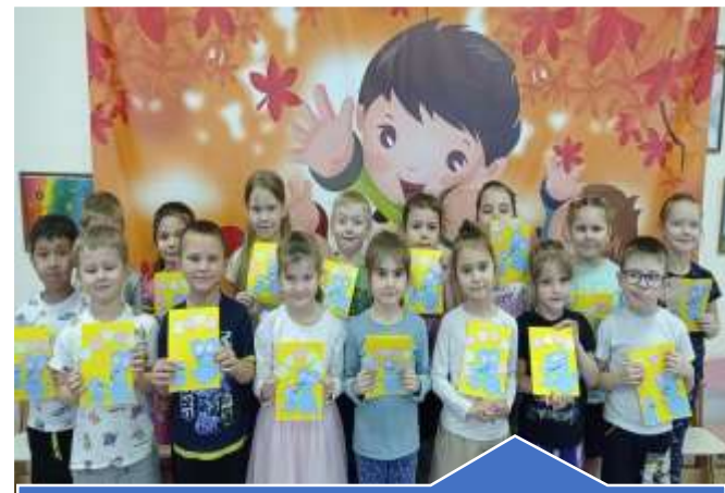
Экспериментально – творческий проект «Новая жизнь старой бумаги»