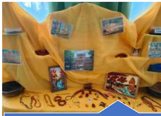
Исследовательский проект «Янтарь - волшебные слезы деревьев»