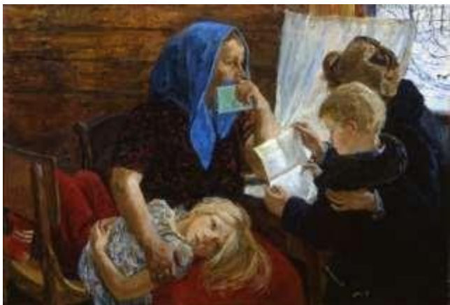
Пластов Аркадий Александрович «Письмо»