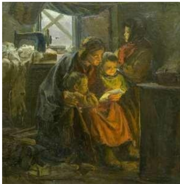
Шурпин Федор Саввич «Письмо с фронта»