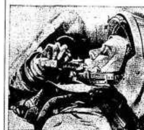
VALENTINA TEREZHKOVA, 28, first female launched by the Russians into orbit, apparently takes food from container during a training session.