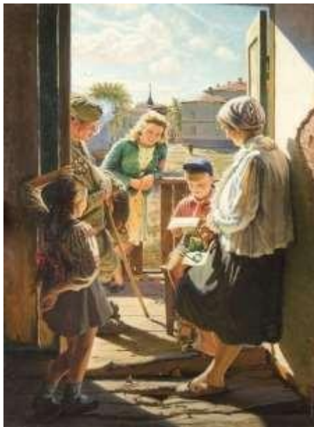
Александр Лактионов «Письмо с фронта»