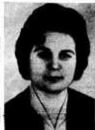
Валентина Терешкова, первая женщина-космонавт.

«КОСМОС» ЭТОТ ДЕНЬ В НАШЕЙ жизни... Валентина Терешкова, уроженка Ярославля, стала первой женщиной-космонавтом. Она была запущена на орбиту в корабле «Восток-6» вместе с собакой Белка. Полет длился 49 часов 38 минут. Терешкова совершила 1480 витков вокруг Земли, совершила 10 выходов в открытый космос, выполнила 40 научных экспериментов. После возвращения на Землю она была встречена в аэропорту и принята в Кремль. Ее полет вызвал огромный интерес во всем мире.