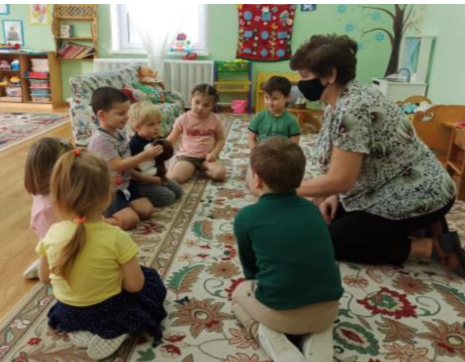
Обсуждение в ходе утреннего круга