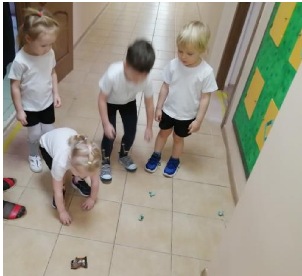
Педагогическая ситуация «Фантики в коридоре»