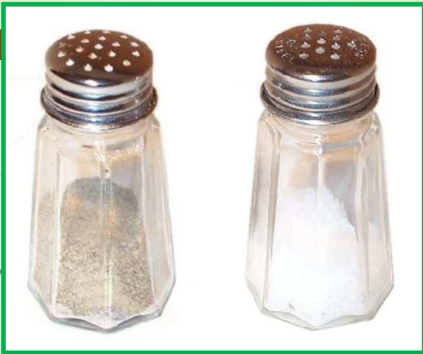
Перечница, в которую насыпают перец и солонка, в которую насыпают соль.